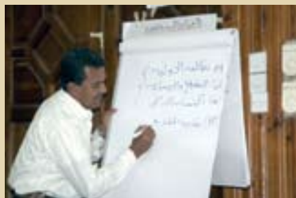
Un jefe de equipo dirige un seminario sobre desarrollo local y mitigación de la pobreza en el Yemen.

La labor conjunta del Fondo de las Naciones para el Desarrollo de la Capitalización (FNUDC) y el PNUD sobre desarrollo local por conducto de las autoridades locales en los países menos adelantados se basa en su mandato combinado de fomento de la capacidad y suministro de recursos de inversión a los gobiernos locales. Las contribuciones del FNUDC mediante capital de inversión para subvenciones globales para fines determinados, apoyo al fomento de la capacidad y servicios de asesoramiento técnico son indispensables para poner a prueba innovaciones que, cuando resultan satisfactorias, pueden ser ampliadas por los gobiernos nacionales y duplicadas en otros países que se enfrentan con problemas semejantes. El FNUDC es administrado por el PNUD.