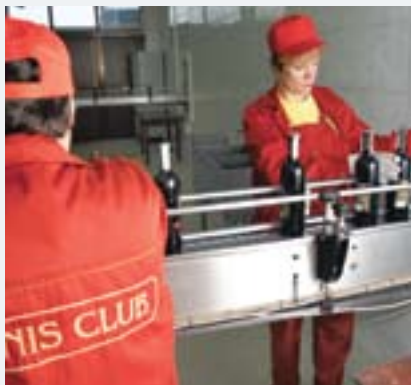
Trabajadores de una bodega en Moldova etiquetan botellas. Una iniciativa de promoción de la actividad empresarial sostenible presta asistencia a los productores vitivinícolas, entre otras cosas, para ajustar el tamaño de las botellas a las normas de la Unión Europea.

en un 20%. Casi la mitad de los prestatarios fueron mujeres, que también representaron el 46% de los 1.000 empleos creados como resultado de la iniciativa. Al mismo tiempo, se han establecido 25 programas de alfabetización de adultos en toda la región, así como dos nuevos jardines de infantes que permiten a las mujeres asistir a clase mientras sus niños son cuidados. La iniciativa ha creado una base de datos socioeconómicos que permite el seguimiento de los progresos en la región en esferas fundamentales, incluido el crecimiento demográfico, el tamaño de los hogares, el número de cabezas de ganado, la superficie y el porcentaje de tierra cultivable y las tasas de alfabetización. Sobre la base del proyecto y de otras iniciativas semejantes adoptadas en el país, se ha promulgado un decreto por el que se permite el establecimiento y mantenimiento de nuevas instituciones de microfinanciación en Jabal Al-Hoss y otros lugares.