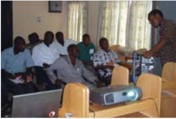
En toda Ghana, centros de información de la comunidad como éste, respaldados por el PNUD, amplían el acceso a computadoras y otras herramientas de comunicaciones, e imparten capacitación técnica. La fotografía ilustra una clase de conocimientos básicos sobre equipos de computación.

la participación del público en la propuesta de soluciones para la mitigación de la pobreza. El proyecto ha tenido el doble beneficio de hacer que las estrategias de lucha contra la pobreza respondan mejor a las necesidades y demandas de los más afectados y de aumentar el nivel de participación pública. Al mismo tiempo, por medio de la investigación a nivel popular se ha obtenido una base de datos fiable de recursos disponibles a nivel local, incluidas listas de expertos, actividades de programas e inversiones, que pueden consultarse y compartirse en todo el país. Esta información se ha reunido por medio de una encuesta de hogares, coordinada por el PNUD y la Facultad Latinoamericana de Ciencias Sociales (FLACSO), con sede en Costa Rica , en que participaron 12.500 hogares de 47 municipios de tres regiones del país.