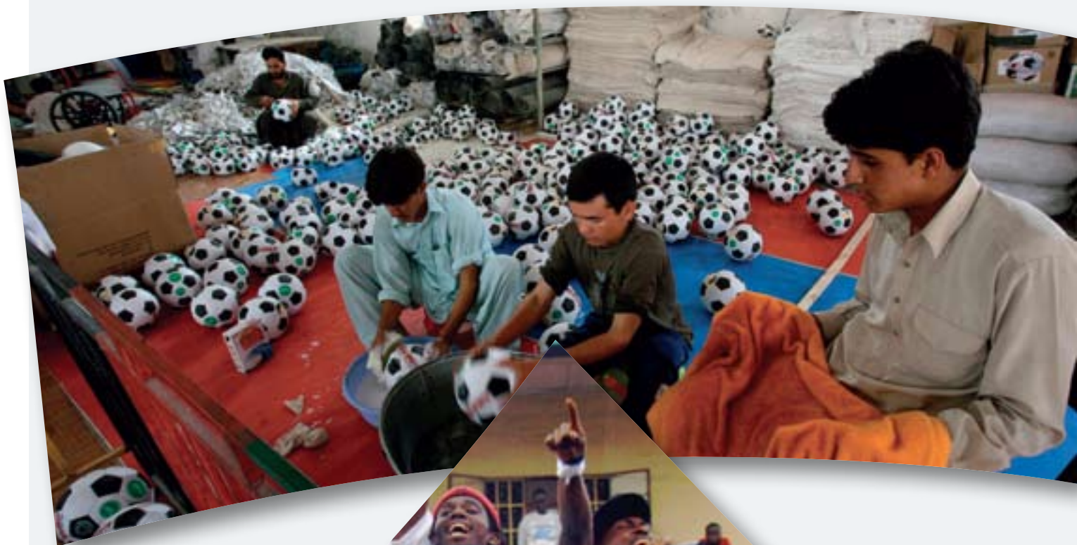
Una moderna fábrica de artículos deportivos en Kabul, establecida por el Ministerio de Comercio del Afganistán, ofrece empleo a los afganos afectados por la guerra.