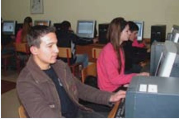
El PNUD ayuda a Albania a equipar escuelas secundarias con laboratorios de computación para unos 140.000 estudiantes.

especializados a competencias más cualitativas en materia de liderazgo, sistemas de incentivos y mecanismos que fortalezcan las normas éticas y las medidas contra la corrupción. Una tercera tendencia es el renovado interés en el aprendizaje permanente y la enseñanza terciaria que, combinados con respuestas innovadoras al éxodo intelectual en sectores fundamentales, se propone aprovechar los beneficios de un mercado de trabajo mundial caracterizado por una movilidad cada vez mayor, convirtiendo los peligros potenciales en oportunidades.