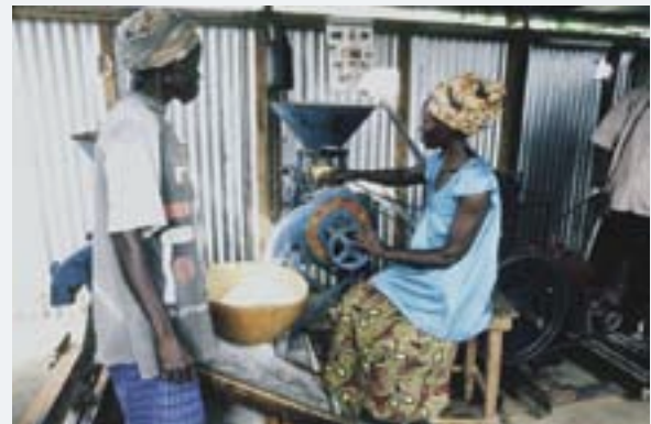
La plataforma multifuncional de bajo costo respaldada por el PNUD ayuda a mujeres de Burkina Faso, Malí y el Senegal a incrementar su productividad e ingresos. Recientemente la Fundación Bill y Melinda Gates asignó 19 millones de dólares al proyecto.

A medida que cambia la base de la estructura tradicional de la asistencia, surge la necesidad creciente de desarrollar la capacidad para acceder, negociar y contribuir a las nuevas modalidades de desarrollo. Los mecanismos nacionales de coordinación y gestión de la asistencia han tenido que responder rápidamente a la presión cada vez mayor de obtener más y mejores resultados. El enfoque del PNUD respecto del fomento de la capacidad evoluciona permanentemente para hacer frente a estos retos y trasciende la ejecución de proyectos separados para abordar la cuestión de los elementos institucionales que impulsan el cociente de capacidad de un país. El PNUD trabaja con sus asociados para el desarrollo a fin de que las organizaciones e instituciones obtengan resultados que beneficien a todos, contribuyendo así al impulso mundial que transforma positivamente las vidas de las personas.