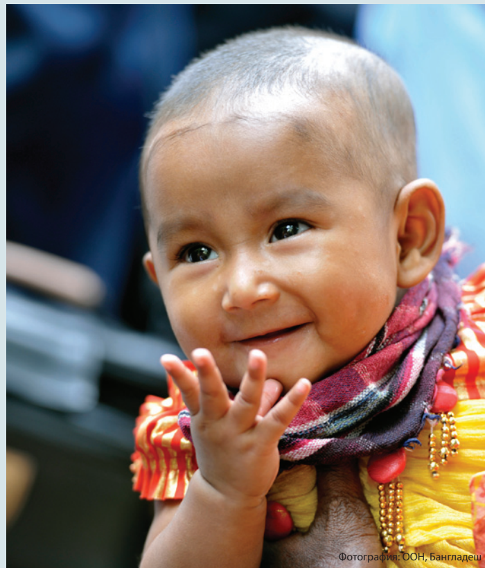
Фотография: ООН, Бангладеш

Реалистичность нового набора глобальных целей зависит от возможности продемонстрировать наши конкретные успехи по ЦРТ, а также от укрепления и поддержки прогресса ЦРТ. Ориентиры по ЦРТ, в том числе задачи и показатели, должны помочь странам в создании надежной основы для определения прогресса развития после 2015 года.