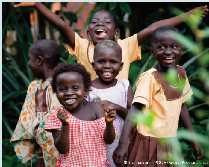
Фотография: ПРООН/Кейла Кеенан, Гана

СУЦ направлена на поддержку правительств в разработке планов действий национального уровня с вовлечением многих партнеров чтобы ускорить усилия направленные на запаздывающиеся задачи. Эти планы действий должны быть разработаны в контексте существующих процессов планирования. Как только страна определяет отстающие задачи ЦРТ, СУЦ способствует правительству данной страны: (1) определить стратегические меры, необходимые для достижения ЦРТ к 2015 году; (2) выявить главные трудности, препятствующие эффективной реализации приоритетных мер; (3) определить