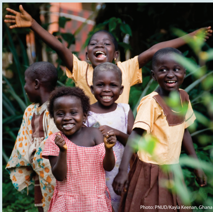
Ghana

Le CAO soutient les gouvernements dans la conception de plans d'action multipartites nationaux visant à améliorer le taux de progression des OMD qui ont pris du retard, dans le cadre de leurs processus et cycles de planification existants. Une fois qu'un pays a identifié une cible OMD à la traîne, le CAO aide son gouvernement à : (1) identifier les interventions stratégiques requises pour atteindre les OMD d'ici 2015 ; (2) établir un ordre