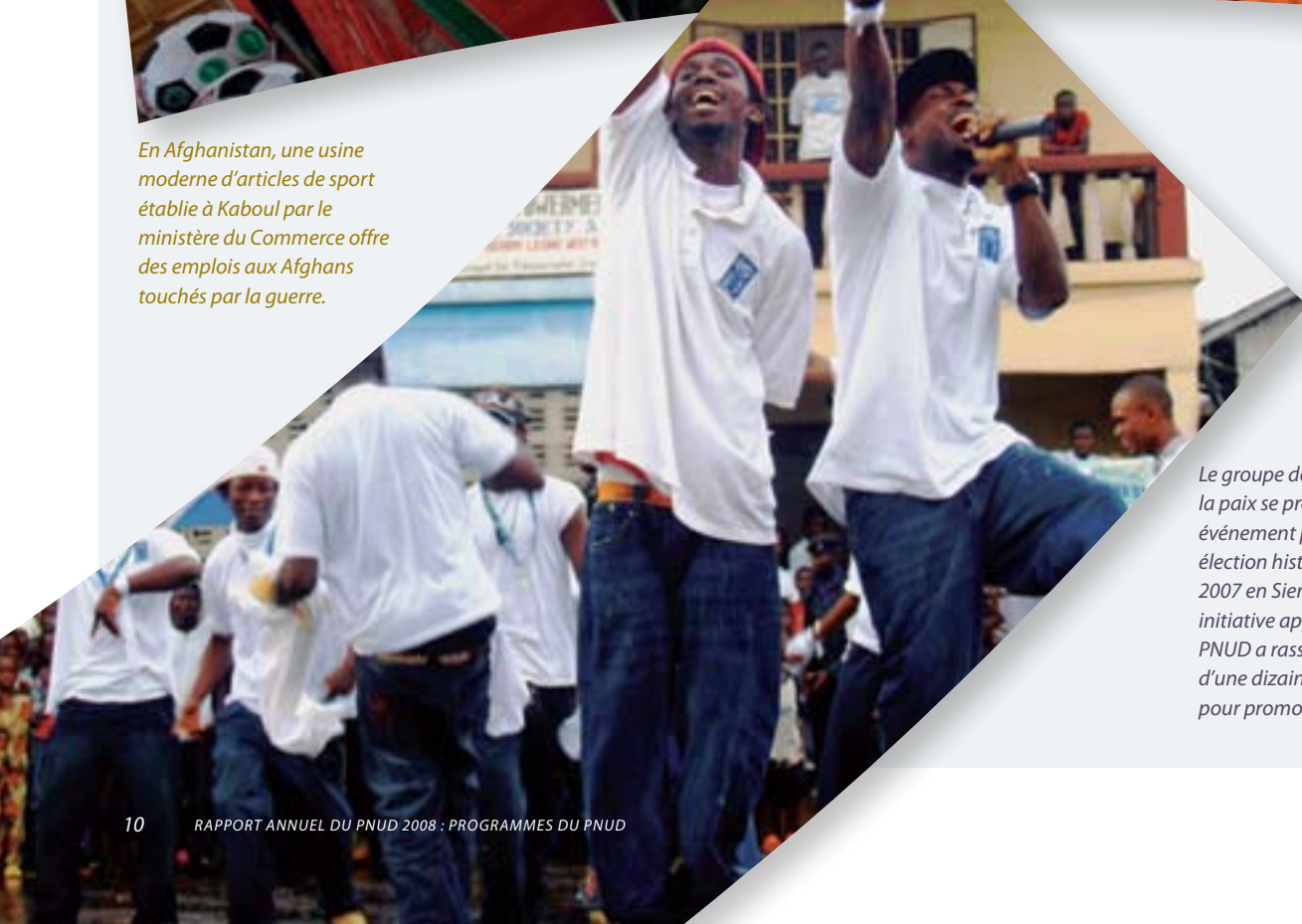
Le groupe des Artistes pour la paix se produit à un événement précédant les élections historiques d'août 2007 en Sierra Leone. Cette initiative appuyée par le PNUD a rassemblé plus d'une dizaine de musiciens pour promouvoir la paix.