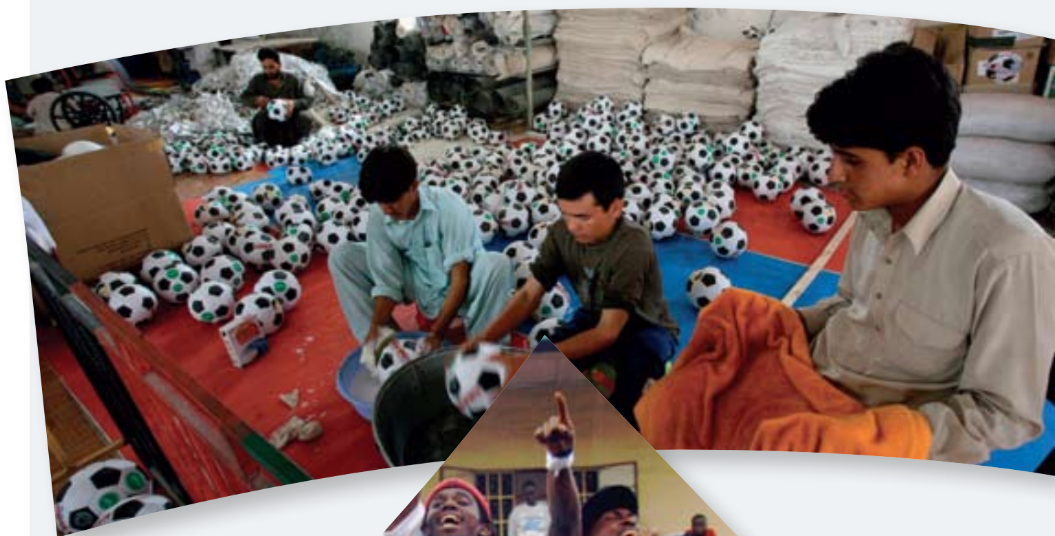
En Afghanistan, une usine moderne d'articles de sport établie à Kaboul par le ministère du Commerce offre des emplois aux Afghans touchés par la guerre.