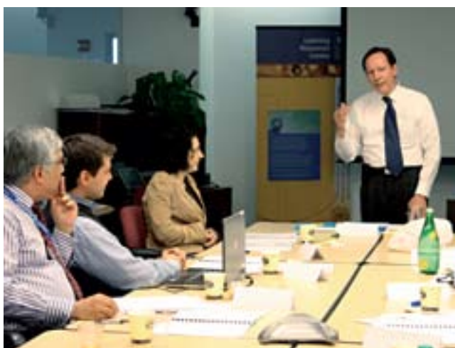
En 2008 el Centro de Recursos de Aprendizaje del PNUD celebró decenas de reuniones de capacitación para el personal.

La estrategia de recursos humanos del PNUD se basa en la convicción plena de que los recursos humanos guardan relación con las personas y que éstas son el patrimonio básico del PNUD. Responde directamente a los cambios internos y externos que afectan el entorno de trabajo y aborda la cuestión de las prioridades del plan estratégico en materia de recursos humanos. En 2008 el PNUD elaboró y puso en práctica un marco de competencias que permitirá aclarar las expectativas del personal y establecer normas claras de desempeño. Al elaborar un plan de acción en materia de género, se ha prestado renovada atención a la promoción y retención de las mujeres. La estrategia de recursos humanos también responde a los aspectos señalados en las encuestas mundiales del personal del PNUD y otras consultas con el personal. Las encuestas han indicado un alto nivel de orgullo del personal sobre su lugar de trabajo y su labor, aunque el equilibrio entre el trabajo y la vida familiar y la presión del trabajo siguen siendo una preocupación fundamental del personal. Las mejoras en el marco de la estrategia se