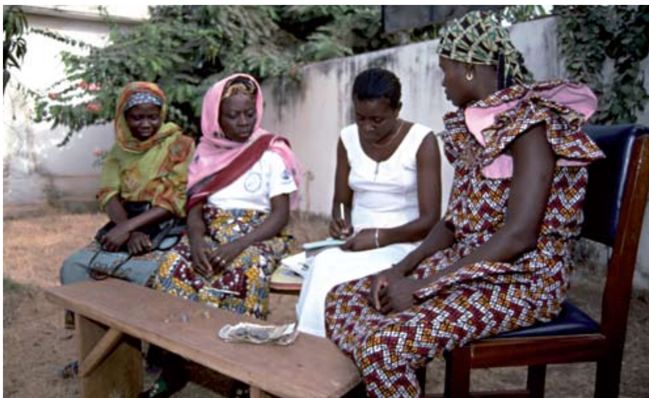
Una oficial de crédito de una institución de microfinanciación respaldada por el FNUDC recauda pagos de préstamos y asesora a mujeres empresarias del Togo septentrional sobre las mejores prácticas de negocios.

de los alimentos y de los combustibles, y continuará desempeñando un papel de liderazgo en la elaboración de opciones estratégicas para hacer frente a las consecuencias de largo plazo de estas crisis. El plan estratégico desempeña un papel fundamental en relación con esta cuestión, al suministrar un esquema claro y coherente para las actividades del PNUD en materia de desarrollo. El plan seguirá fijando la visión estratégica general, así como las prioridades de desarrollo, gestión y recursos del PNUD e incluirá, por primera vez, indicadores específicos y metas de desarrollo, la coordinación de las Naciones Unidas y los resultados de la gestión, una innovación que mantendrá a la organización bien encaminada y centrada en los difíciles tiempos que se avecinan. Concretamente, el plan define las actividades operacionales del PNUD en torno a sus cuatro esferas prioritarias de desarrollo, a saber, reducción de la pobreza y logro de los ODM, gobernanza democrática, prevención de crisis y recuperación, y medio ambiente y desarrollo sostenible, y establece una clara