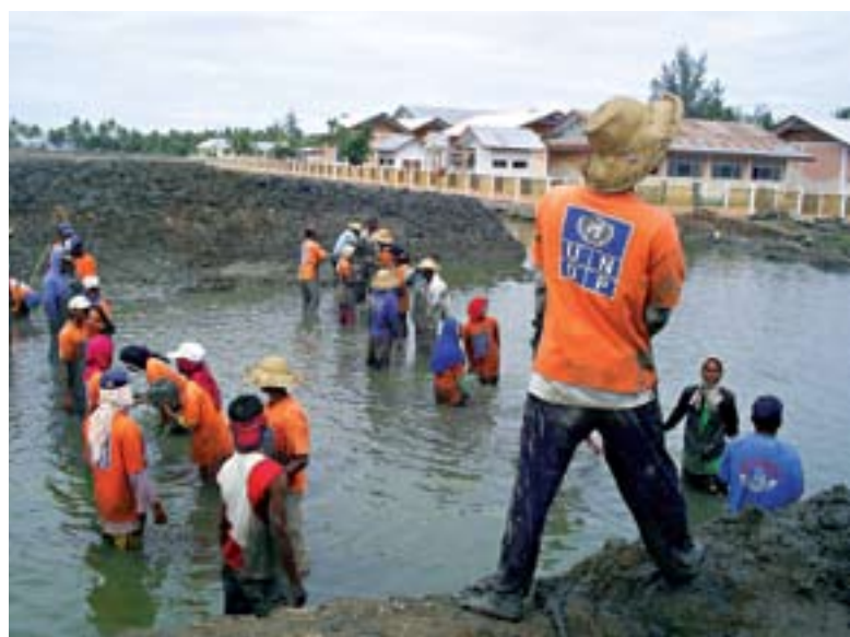
EL PNUD continúa prestando apoyo a comunidades de Indonesia luego del tsunami de 2004. En la fotografía los trabajadores limpian un estanque para la cría de peces.

El PNUD reconoce que el intercambio de recursos, tecnología y conocimientos entre países en desarrollo, es decir la cooperación Sur-Sur, es fundamental para que las actividades de desarrollo tengan éxito, incluidas las de prevención de crisis y recuperación. En Haití , el PNUD trabajó con el Gobierno para aplicar un modelo