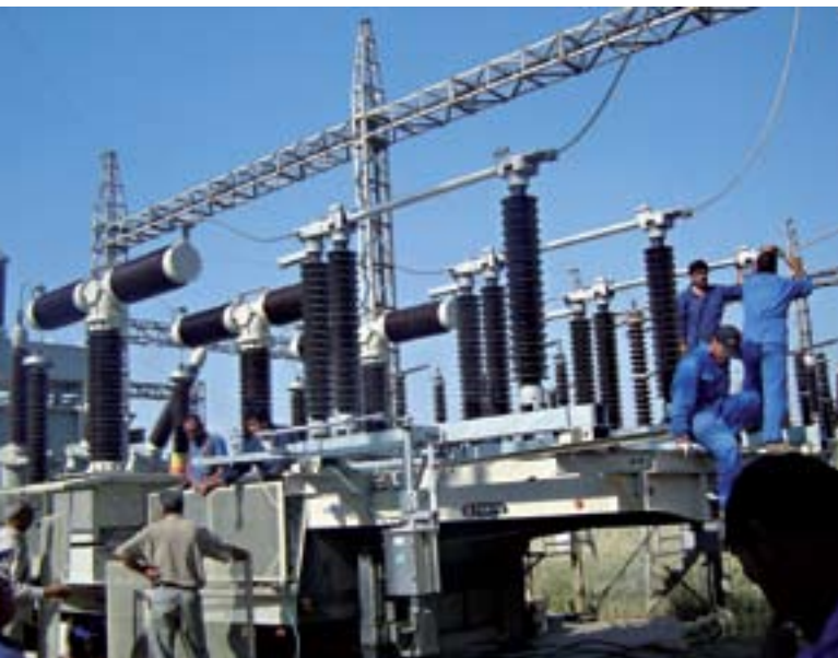
El PNUD, con el apoyo del Gobierno del Japón, trabajó con el Gobierno del Iraq para mejorar el suministro de electricidad en la región kurda.

El restablecimiento de la seguridad a nivel de la comunidad, la reconstrucción de la cohesión social y la promoción de la reconciliación son indispensables para la recuperación duradera después de un conflicto violento.