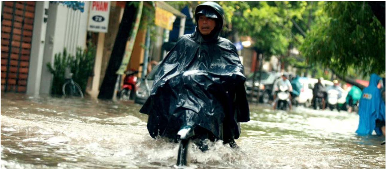
Nhiều người lo lắng về tình trạng dễ bị tổn thương ngày càng gia tăng, ví dụ người nghèo nông thôn thường chịu thiệt hại to lớn do thiên tai.

Tham vấn được thực hiện với các nhóm yếu thế của xã hội. Chủ đề về một xã hội dành cho tất cả mọi người được hầu hết các nhóm nhấn mạnh: nhóm dân tộc ít người, người cao tuổi (đặc biệt là người cao tuổi nghèo khó), người có HIV/AIDS, người khuyết tật, người nghèo nông thôn, người nghèo thành thị và người nghèo nhập cư. Họ bị phân biệt đối xử bởi cán bộ công quyền trong các cơ quan dịch vụ công và bị ngăn cách hòa nhập với xã hội. Bị cô lập trong xã hội và trong cuộc sống hàng ngày trên phương diện xã hội và kinh tế, họ bị mắc kẹt trong vòng quay của sự phân biệt và túng thiếu. Vấn đề này chỉ có thể được giải quyết bằng cách tăng cường sự tham gia của mọi người dân, như đã được nhấn mạnh trong suốt quá trình tham vấn, trong hội thảo cấp quốc gia tháng 3 năm 2013 và trong các tài liệu nghiên cứu. Tăng cường sự tham gia của người dân đã trở thành thông điệp mạnh mẽ cho kỷ nguyên sau năm 2015. Đây là yếu tố then chốt để đảm bảo cho viễn cảnh kinh tế năng động và ổn định của Việt Nam trong tương lai.