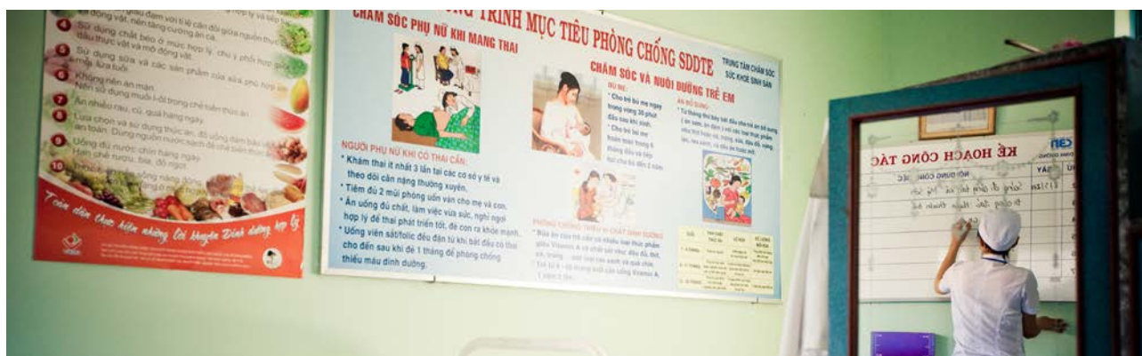
Mang đến cơ hội tiếp cận dịch vụ chăm sóc y tế đạt tiêu chuẩn với chi phí hợp lý đóng vai trò quan trọng đối với sự phát triển trong tương lai của Việt Nam.