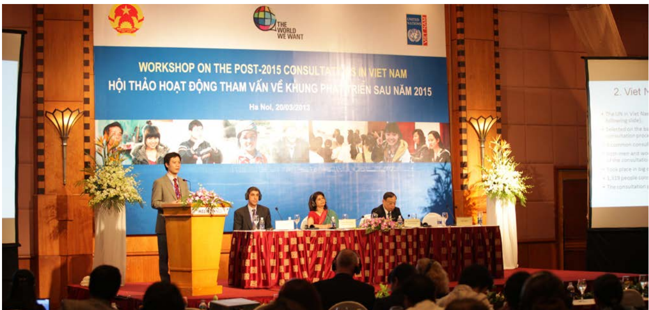
Hội thảo Tham vấn quốc gia về Chương trình phát triển sau năm 2015 vào ngày 20 tháng 3 năm 2013 tại Hà Nội.

Lời khẳng định này đưa ra một định hướng rõ ràng cho tiến trình phát triển sau năm 2015 trên toàn cầu và đưa ra một khuôn khổ để Việt Nam có thể suy nghĩ và lập kế hoạch cho tương lai sau năm 2015. Ban Công tác đã đặt một yêu cầu đối với tất cả chúng ta về ‘các thay đổi mang tính cải tổ nhằm hướng tới sự phát triển bền vững, lấy con người làm trọng tâm và dành cho tất cả mọi người’. Viễn cảnh cho tương lai phải dựa trên các nguyên tắc cơ bản về quyền con người, sự bình đẳng và bền vững như các giá trị được chia sẻ trên toàn thế giới và đã được phản ánh trong Hiến pháp của Việt Nam và trong các Hiệp ước LHQ mà Việt Nam tham gia ký kết.