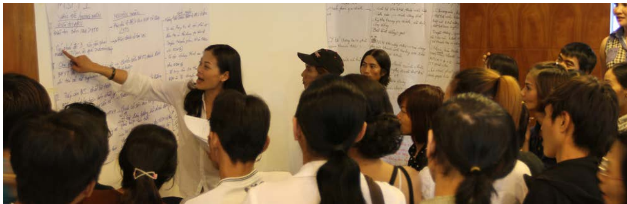
Những người có HIV/AIDS xác định kỳ thị và phân biệt đối xử là các thách thức lớn mà họ phải đối mặt.

Người có HIV/AIDS: Phân biệt đối xử và bị xa lánh là chủ đề chính trong các buổi tham vấn đối với nhóm người có HIV/AIDS và người sử dụng ma túy. Sự phân biệt đối xử và kỳ thị có thể được cảm nhận rõ ràng ở mọi cấp độ, từ gia đình, xã hội, cơ quan nhà nước và các đơn vị cung cấp dịch vụ trong xã hội nói chung. Nhóm cho biết họ bị các cơ sở y tế phân biệt đối xử và họ rất thiếu thông tin về quyền lợi cũng như các vấn đề của mình.