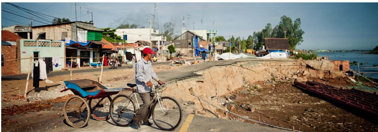
Việt Nam rất nhạy cảm với các tác động của biến đổi khí hậu và vấn đề này cần được chú ý giải quyết.

1. Phát triển trong một thế giới hạn hẹp về nguồn lực: Đối phó với thách thức biến đổi khí hậu trên toàn cầu và đảm bảo môi trường bền vững trong tương lai. Chủ đề này nhấn mạnh vào tính dễ bị tổn thương của Việt Nam trước ảnh hưởng của biến đổi khí hậu và do vậy cần từng bước hành động để thích ứng, giảm thiểu tác động của biến đổi khí hậu cũng như giải quyết nguyên nhân gốc rễ của vấn đề. Giải quyết vấn đề biến đổi khí hậu sẽ kéo theo sự thay đổi về phương thức sản xuất và tiêu thụ, cụ thể là chúng ta cần điều chỉnh hành vi để đảm bảo sự bền vững môi trường trong tương lai. Chính phủ Việt Nam cần đóng vai trò then chốt để đảm bảo rằng Việt Nam hoạch định và quản trị một tương lai bền vững về môi trường.