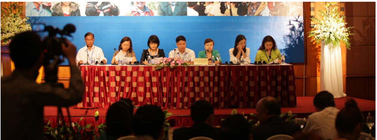
Tiếng nói từ hoạt động tham vấn với sự tham gia của người dân từ tám nhóm mục tiêu tại Hội thảo Tham vấn quốc gia về Chương trình Phát triển sau năm 2015 tại Hà Nội ngày 20 tháng 3 năm 2013.

Quá trình tham vấn bắt đầu vào tháng 11 năm 2012 và kết thúc vào tháng 1 năm 2013. Báo cáo và các tài liệu tham vấn đã được hoàn thiện trong khoảng thời gian từ tháng 1 đến đầu tháng 2 năm 2013. Tháng 3 năm 2013, LHQ tại Việt Nam và Chính phủ Việt Nam đã tổ chức một hội thảo về những phát hiện trong quá trình tham vấn.