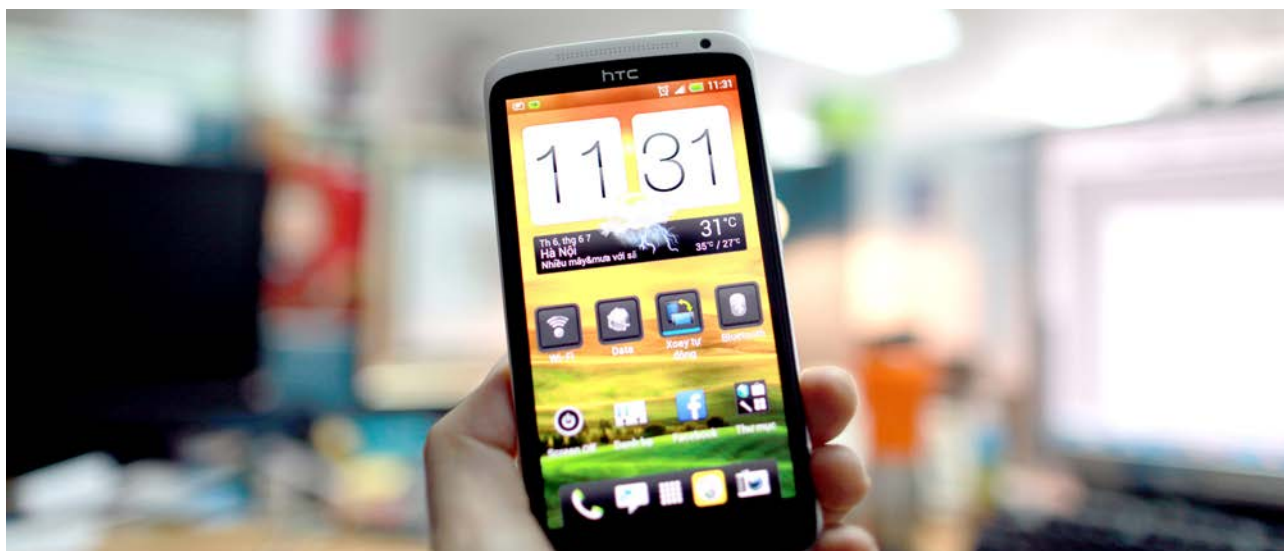
Mô hình phát triển mới cần tập trung vào nền sản xuất dựa trên công nghệ cao nhằm giúp tăng cường năng lực của Việt Nam.

Tăng trưởng kinh tế là điều kiện cần để đáp ứng các mong muốn này. Tuy nhiên, hạn chế của mô hình phát triển kinh tế hiện nay của Việt Nam ngày càng trở nên rõ ràng. Tăng trưởng của Việt Nam phụ thuộc nhiều vào nguồn nhân công giá rẻ và dây chuyền sản xuất kỹ thuật thấp và phân bố không đồng đều giữa các vùng và các nhóm dân cư. Một bộ phận dân cư như nông dân, dân tộc ít người không có khả năng tham gia vào nền kinh tế, nên phải tiếp tục sử dụng các hình thức sản xuất nông nghiệp hiệu suất thấp. Họ không có cơ hội thoát nghèo trong mô hình phát triển hiện tại. Do đó, cải thiện chất lượng việc làm phải gắn liền với xây dựng một mô hình phát triển mới cho Việt Nam.