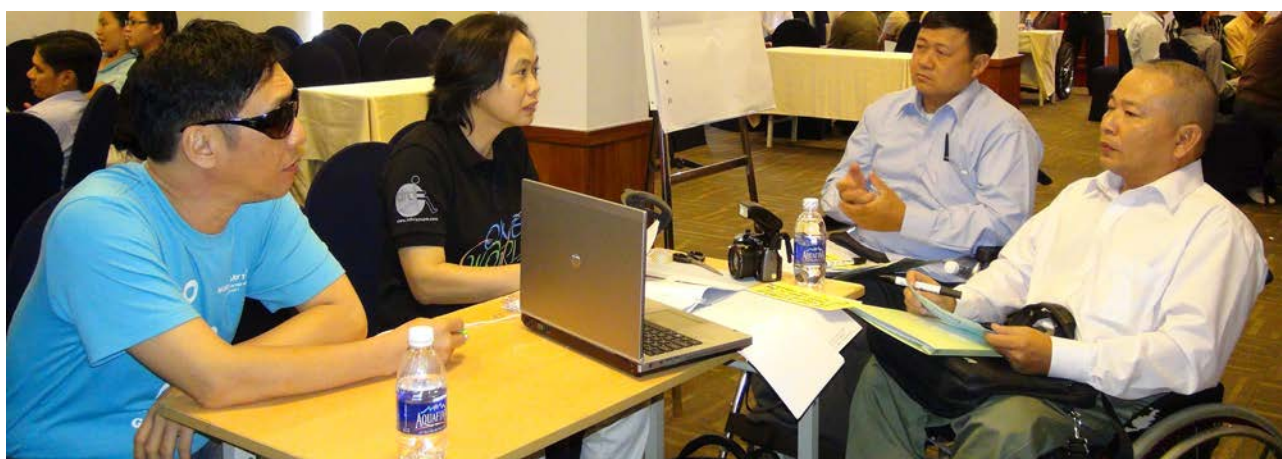
Người khuyết tật thể hiện mong muốn được đối xử bình đẳng và được tôn trọng.