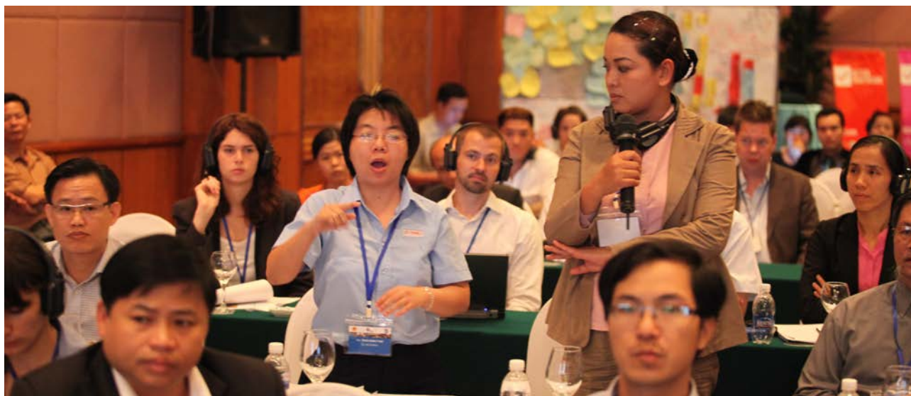
Hơn 1.300 người bao gồm nam, nữ và trẻ em tham gia tham vấn về tương lai mọi người mong muốn.

Trong suốt quá trình tham vấn, phụ nữ và nam giới được đảm bảo có cơ hội như nhau khi chia sẻ những thách thức cũng như khát vọng của bản thân. Hơn một nửa số người tham dự là nữ. Các sự kiện tham vấn được tổ chức trên 13 tỉnh bao gồm các thành phố lớn và vùng nông thôn, và đặc biệt là vùng sâu vùng xa trên toàn lãnh thổ Việt Nam.