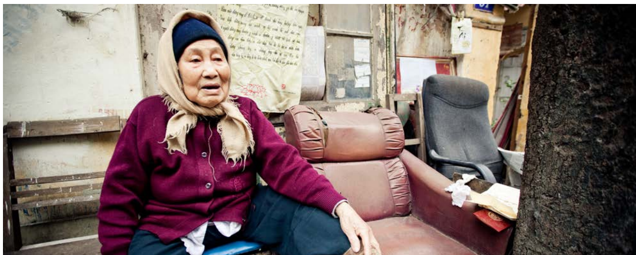
Người dân mong muốn có một hệ thống an sinh xã hội toàn diện cho tất cả công dân Việt Nam.

4. Thay đổi nhân khẩu học tại Việt Nam: Đối diện với sự thay đổi về nhân khẩu học và cần thiết phải có một hệ thống an sinh xã hội toàn diện. Việt Nam đang ở trong giai đoạn nhân khẩu học đặc biệt với rất đông dân số đang trong tuổi lao động và già hóa dân số nhanh. Điều này đem lại cả cơ hội và thách thức đối với hai nhóm dân số này và đối với xã hội nói chung. Đối với thanh niên, thách thức của họ là phải tìm được công việc ý nghĩa và năng suất cao, trong khi người cao tuổi cần một hệ thống an sinh xã hội và chăm sóc của nhà nước phù hợp hơn do truyền thống chăm sóc người cao tuổi trong gia đình đang dần mai một.