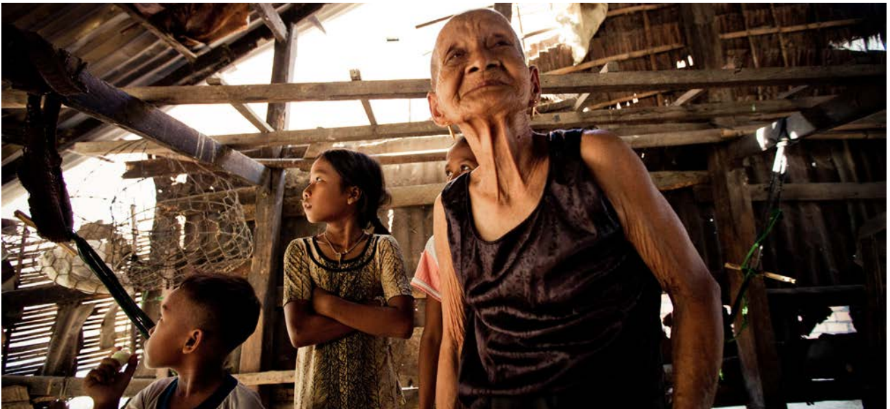
Sự thay đổi về nhân khẩu học ở Việt Nam đang diễn ra nhanh chóng với ngày càng nhiều thanh niên và người cao tuổi

Giai đoạn phát triển dân số này tạo ra cả cơ hội cũng như thách thức cho thanh niên và người cao tuổi. Việt Nam cần tận dụng tiềm năng của lực lượng dân số đông đảo trong độ tuổi lao động bằng cách tạo công ăn việc làm ổn định và phù hợp cho thanh niên để tăng đóng góp cho ngân sách Nhà nước, cung cấp hệ thống giáo dục, y tế có chất lượng và môi trường sống bảo đảm. Đây chính là mong muốn của thanh thiếu niên trong các cuộc tham vấn.