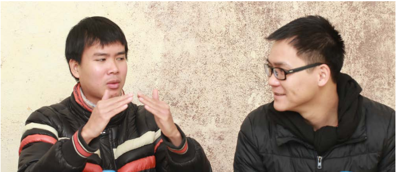
Người khuyết tật mong muốn được đối xử như mọi người khác.

Khuôn khổ pháp lý quốc tế đã có ảnh hưởng tích cực đối với người khuyết tật và quyền lợi của người khuyết tật đã được quy định rõ ràng theo luật pháp Việt Nam. Tuy nhiên, hầu hết mọi người cho rằng luật chưa được thực thi một cách toàn diện. Cụ thể, thông tin và các cơ hội đào tạo nghề cho người khuyết tật rất hạn chế, người khuyết tật thường không có việc làm và bị nhìn nhận là không có khả năng lao động.