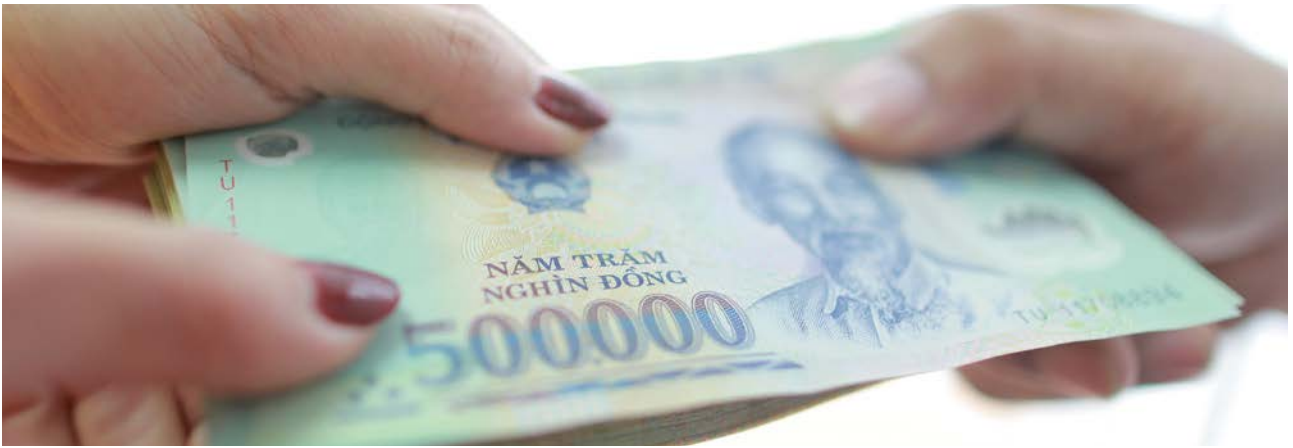
Tham nhũng là một trong những rào cản lớn đối với sự phát triển kinh tế và đe dọa sự ổn định xã hội.

Tăng cường sự tham gia của người dân và cho phép tự do ngôn luận có ý nghĩa quan trọng vì nền dân chủ ở Việt Nam phụ thuộc nhiều vào mối quan hệ giữa nhân dân và Đảng Cộng sản. Việc thúc đẩy phụ nữ tham gia các vị trí quản lý và lãnh đạo có ý nghĩa quan trọng nhằm giảm dần bất bình đẳng giới trong lĩnh vực chính trị và xã hội. Việc tăng cường các cơ chế khuyến khích toàn thể người dân tham gia tích cực vào xã hội và quá trình ra các quyết định, những quyết định được thực hiện mang tính đại diện, sẽ tăng cường mối quan hệ giữa Nhà nước và người dân, và vì vậy sẽ cải thiện và tăng cường chất lượng quản trị công. Tạo điều kiện cho người dân được tự do bày tỏ chính kiến ở nơi công cộng, trên báo in hay mạng xã hội cũng rất quan trọng để đảm bảo xã hội lành mạnh và dân chủ. Truyền thông xã hội và internet tại Việt Nam đang ngày một phổ biến hơn, đặc biệt là với những người trẻ tuổi, và cần xem đây như một cơ hội tăng cường chất lượng điều hành quản trị hơn một mối đe dọa.