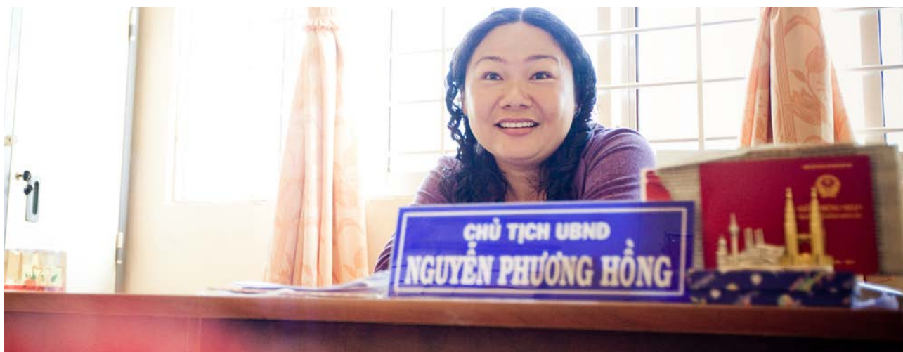
Chất lượng quản trị công, mối bận tâm của nhiều người dân Việt Nam, cần được nêu lên trong khuôn khổ phát triển sau các mục tiêu TNK.

Trong khi Việt Nam đã thực hiện tốt mục tiêu TNK về các vấn đề liên quan đến y tế, sự bất bình đẳng và phân biệt vẫn rất rõ ràng. Tỷ lệ tử vong ở trẻ em sơ sinh và dưới năm tuổi của người Hmông cao gấp ba lần so với tỷ lệ trung bình trên toàn quốc. Các báo cáo năm 2012 cho thấy so sánh với trung bình trên toàn quốc, tỷ lệ tử vong mẹ ở 225 huyện vùng khó khăn cao gấp hai lần và tỷ lệ này ở 62 huyện nghèo nhất cao gấp 5 lần. Một lĩnh vực quan trọng khác khó có thể đo lường là vấn đề chất lượng quản trị, vấn đề mà nhiều nghiên cứu đều đánh giá là mối lo ngại chính của công dân Việt Nam và là một yếu tố có tính quyết định đối với kết quả phát triển. Thách thức cho khuôn khổ hậu mục tiêu TNK là làm thế nào để phản ánh những vấn đề quan trọng nhưng khó định lượng để có thể đảm bảo rằng các yếu tố phát triển con người có thể đo lường một cách đúng đắn và toàn diện.