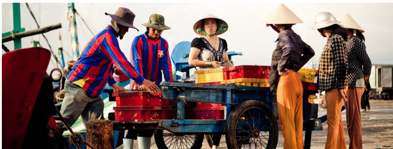
Giải quyết bất bình đẳng về giới là một trong những chủ đề chính được nhiều nhóm đề cập.