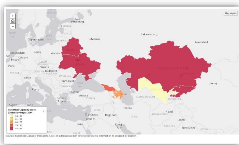
Рис. 1. Индекс статистического потенциала Узбекистана и стран региона

Подтверждению вышесказанному служат также результаты мониторинга портала ОГД, выявившие отсутствие детализированной и подробной информации о результатах деятельности госорганов, в разрезе регионов, полов, социально уязвимых групп. Кроме того, только 60% наборов представлены в машиночитаемых (json, xls, csv) и непроприетарных форматах.