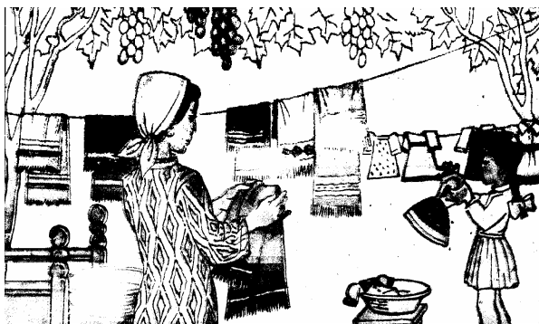
1-расм. Хотин-қизлар иши

1-синф математика дарслигидан олинган ушбу расмларда ҳам эркак ва аёл персонажлар ролларнинг анъанавий тақсимланишига мувофиқ тасвирланганини кўриш мумкин.