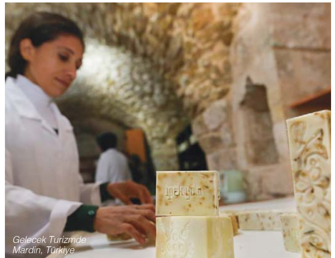
Gelecek Turizmde Mardin, Türkiye

Daha fazla bilgi için: www.gelecekturizmde.com www.dunyalarsenin.com