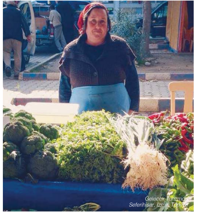
Gelecek Turizmde Seferihisar, İzmir, Türkiye

yemek pişirme sanatı başta olmak üzere birçok konuda eğitim aldık ve bu yaptığımız işte daha da profesyonel olmamız için bir şanstı."