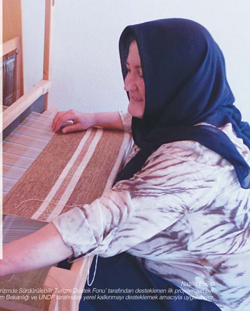
Nazife Ece ©

Gelecek Turizmde Sürdürülebilir Turizm Destek Fonu, projelerin etkilerini ve yörede yaşayan bireylere ve yerel hayata sağladıkları faydaların boyutunu yakından takip ediyor ve projelere proje yönetimi ve iletişim desteği veriyor.