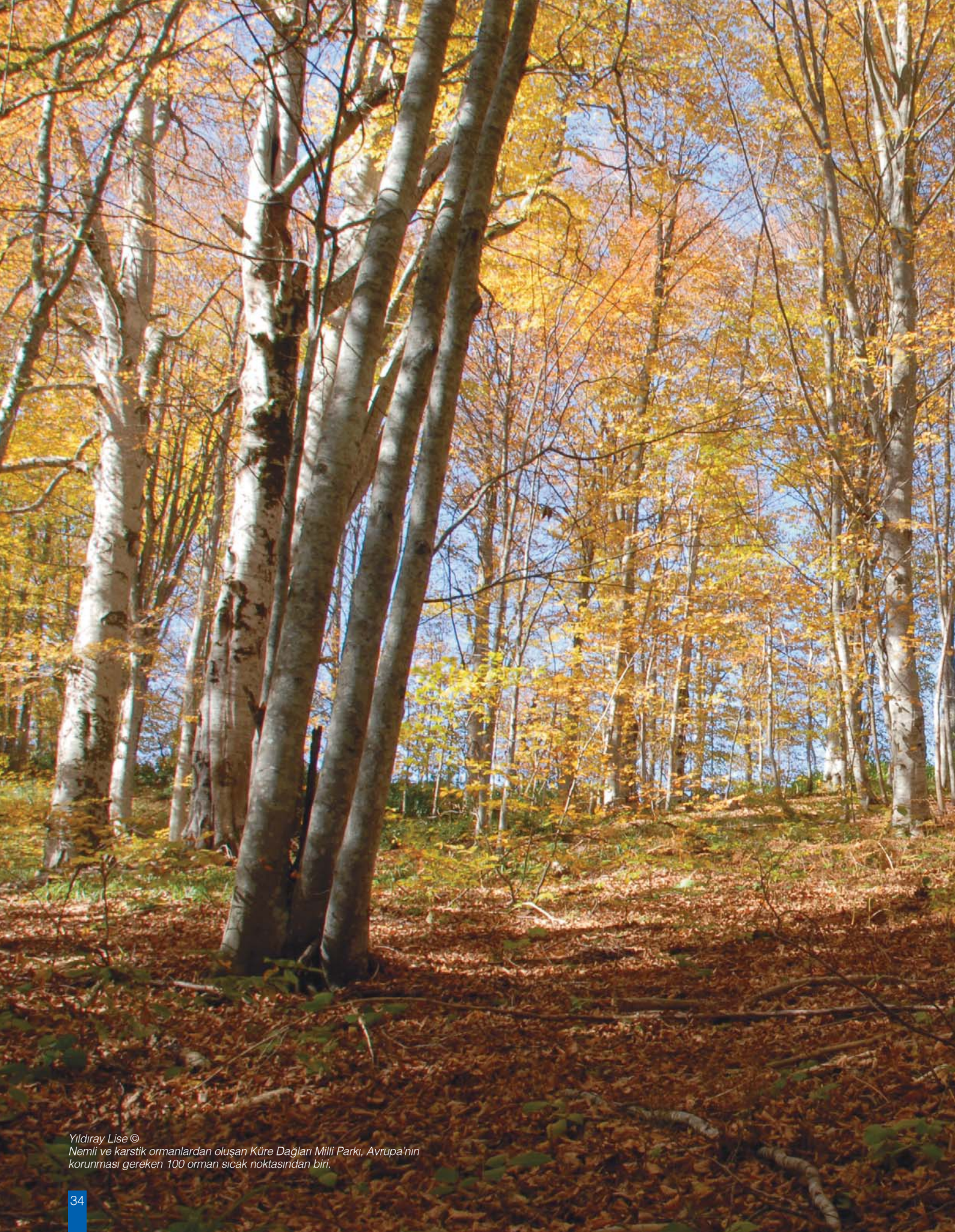
Yıldırım Lise © Nemli ve karstik ormanlardan oluşan Küre Dağları Milli Parkı, Avrupa'nın korunması gereken 100 orman sıcak noktasından biri.