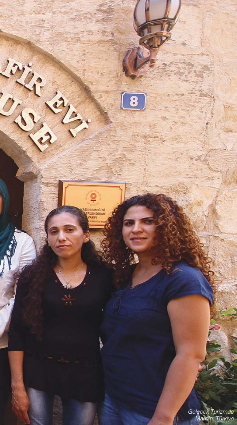
Gelecek Turizmde Mardin, Türkiye

Kadın Emeğini Değerlendirme Vakfı tarafından uygulanan bu proje kapsamında 50 kadın ve genç turizm alanında uzmanlık kazanmak için özel alanlarda meslek eğitimleri aldı.