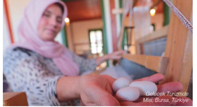
Gelecek Turizmde Misi, Bursa, Türkiye

Yerel sivil toplum örgütleri, bu projelerin uygulayıcı ortakları ve fon, bu sivil toplum örgütlerine gerekli rehberliği, araçları ve kaynakları sağlıyor.