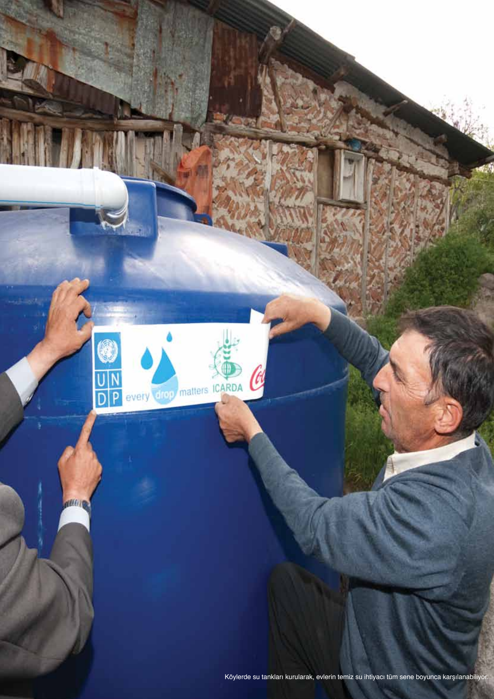
Köylerde su tankları kurularak, evlerin temiz su ihtiyacı tüm sene boyunca karşılanabiliyor.