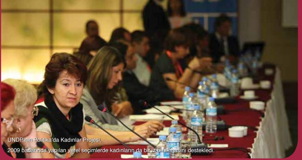
UNDP'nin Politika'da Kadınlar Projesi, 2009 baharında yapılan yerel seçimlerde kadınların da bir iz bırakmasını destekledi.