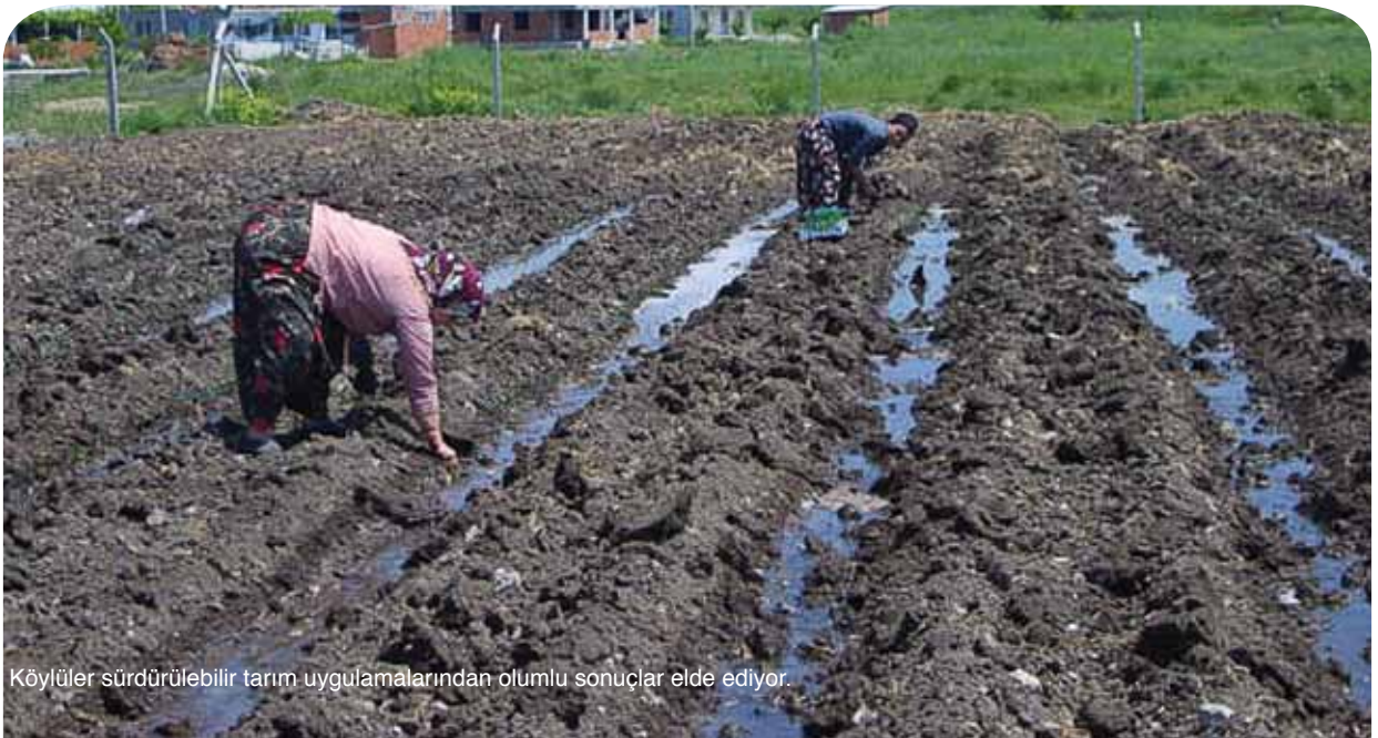
Köylüler sürdürülebilir tarım uygulamalarından olumlu sonuçlar elde ediyor.

Türkiye devleti iklim değışikliđine ilişkin risklerin etkin biçimde idare edilmesi için gerekli kapasiteyi geliştirmek üzere, UNDP’nin yardımı ile, İngiltere ve İspanya gibi ortakların da işbirliğiyle, iklim değışikliđini, ulusal kalkınma çerçevesinde, temel politikanın bir parçası haline getiriyor. UNDP, devletin iklim değışikliđine ilişkin olarak Kyoto rejiminin tamamlanmasının da ötesine geçen hedeflerin hayata geçirilebilmesi için devletle beraber çalışmayı sürdürecektir.