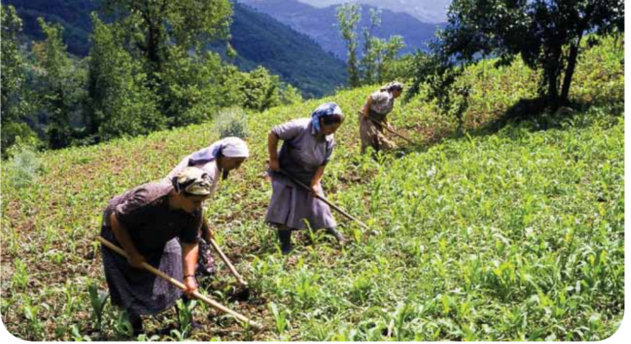
Küçük Hibeler Programı tarımsal organik çiftçilik ve geleneksel tarım yöntemleriyle tarımsal biyoçeşitliliğin korunmasını destekliyor.

Büyüyen bir nüfus, kentleşme ve çevresel bozulma, Türkiye'nin ekosistemlerine giderek artan bir yük bindiriyor. Herkes bundan etkilense de, geçimleri için doğal kaynaklara daha çok bel bağladıklarından, yoksul kesim olumsuz etkilerle çok daha fazla karşılaşılıyor.