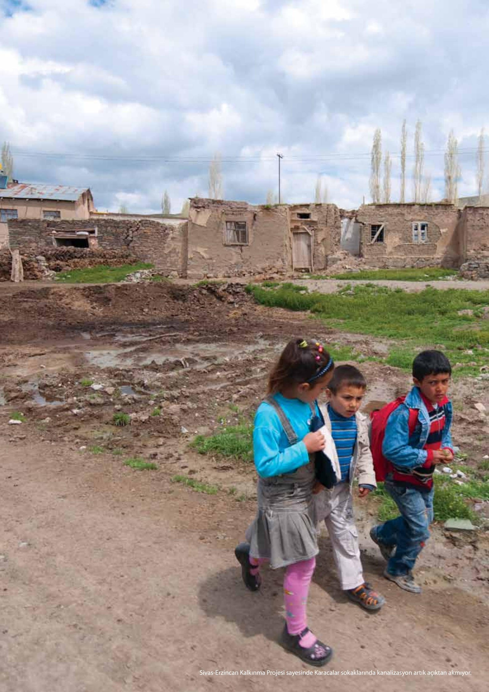
Sivas-Erzincan Kalkınma Projesi sayesinde Karacalar sokaklarında kanalizasyon artık açıktan akıyor.