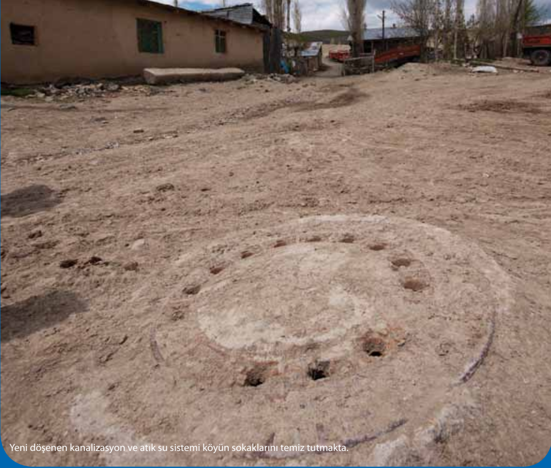
Yeni döşenen kanalizasyon ve atık su sistemi köyün sokaklarını temiz tutmakta.