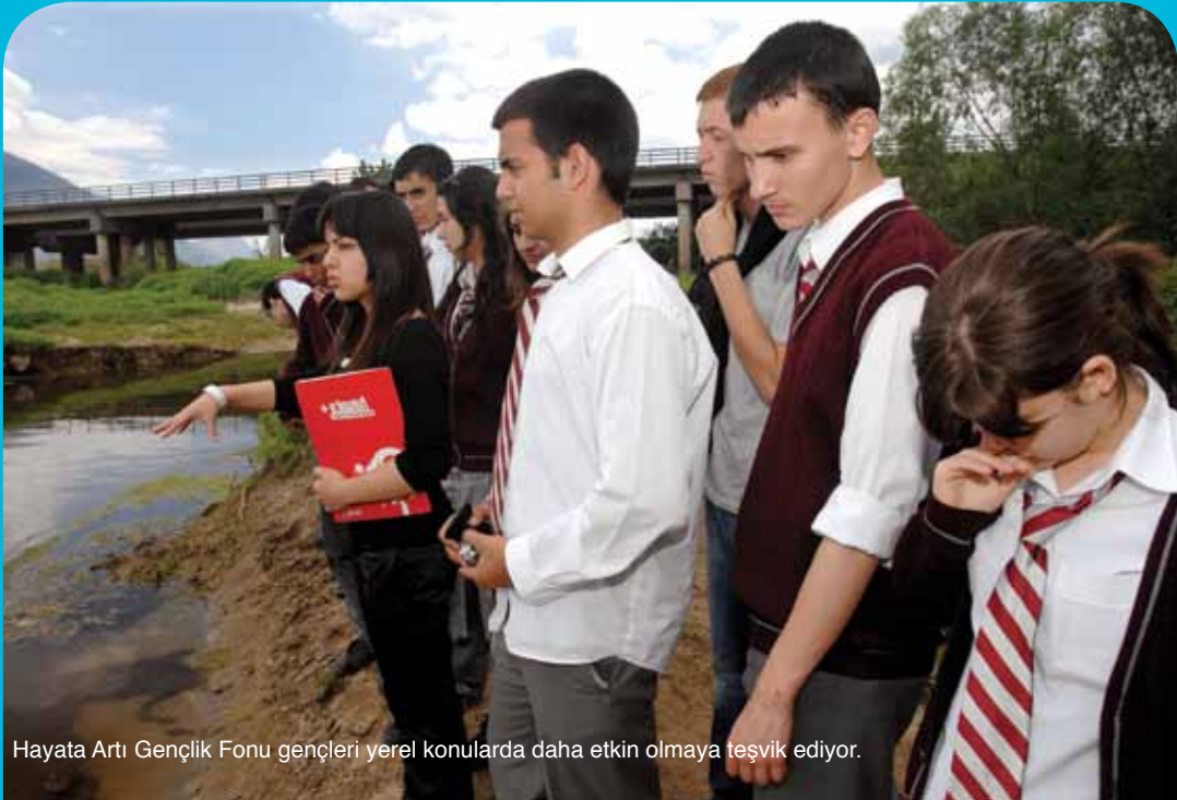
Hayata Artı Gençlik Fonu gençleri yerel konularda daha etkin olmaya teşvik ediyor.