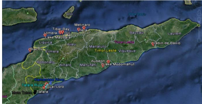
Fatin Targetu Projetu

Atu háforsa kapasidade reziliensia ba comunidade sira ne'ebé hela iha tasi-ibun liu husi introdusaun kona-ba aproximasaun halo protesaun iha tasi-ibun no natureza