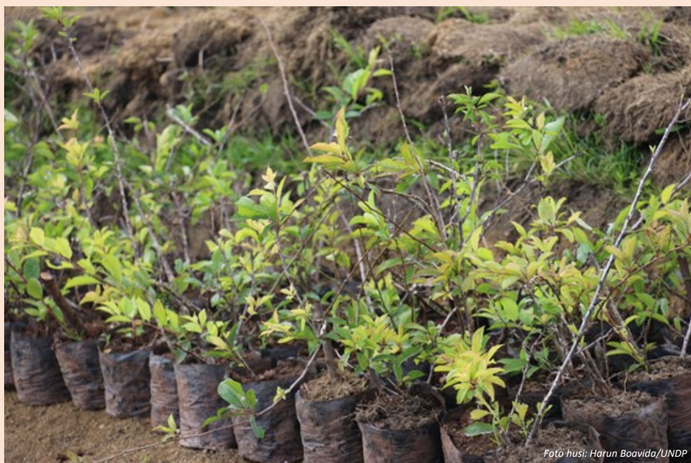
Ai-oan ne'ebé prontu atu kuda iha area reflorestasaun Aituto-Ainaro.