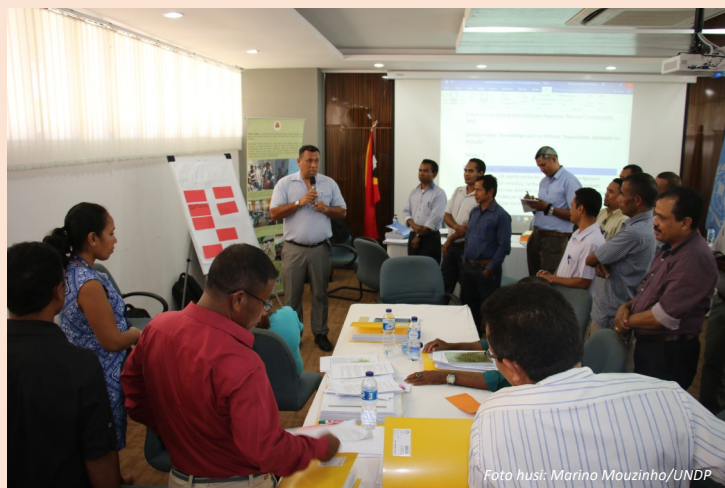
Konsultasaun nasionál kona-ba revizaun manual treinamentu JRD. Fasilita hosi UNDP no CCCB-UNTIL.

Maizomenus funsióariu governu nasionál no munisípál na'in 25, barak liu hosi INAP, DNJRD, MKIA, MSS no Administrasaun Munisípál sira hosi Ainaro no Aileu mak partisipa iha eventu ne'e, no partisipante sira hato'o sira-nia hanoin no sujestaun atu hadi'ak manual formasaun ne'e.