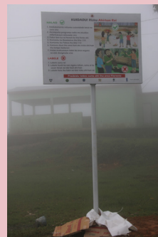
Suco Talitu, Aileu