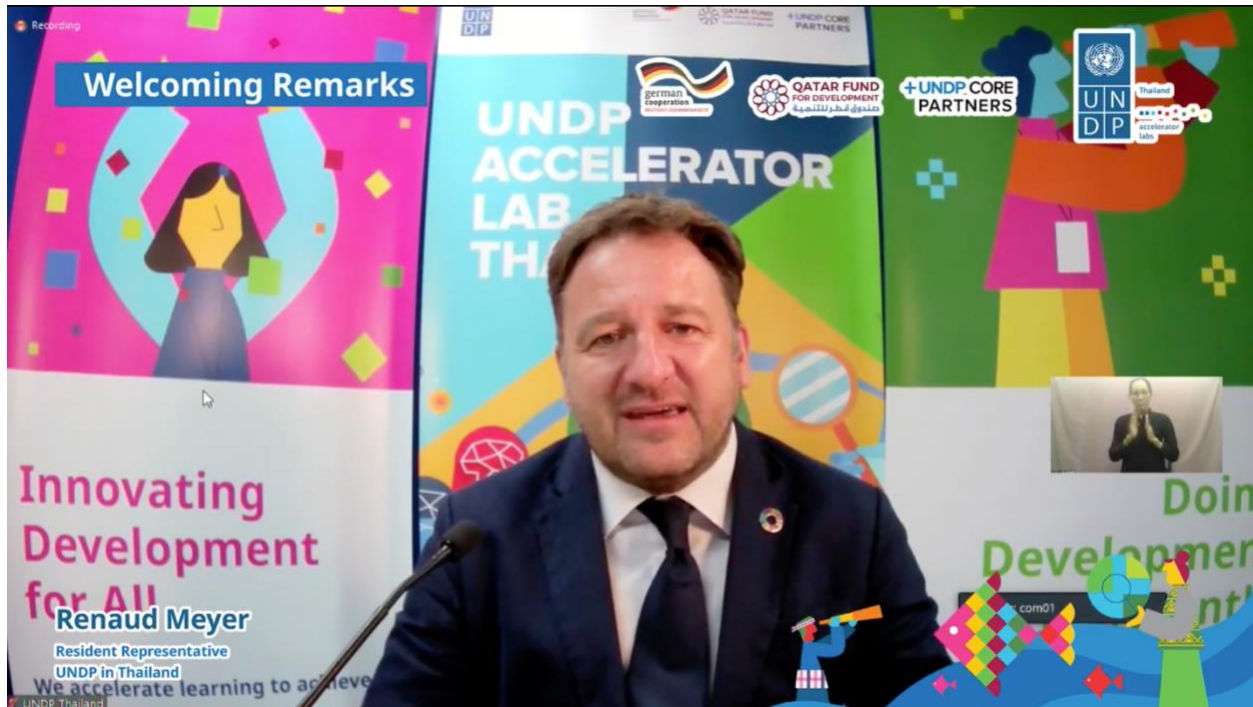
เรอโน เมแยร์ ผู้แทน โครงการพัฒนาแห่งสหประชาชาติประจำประเทศไทย

“การรับมือกับความท้าทายด้านการพัฒนาที่ซับซ้อนในปัจจุบันไม่สามารถทำได้เพียงลำพัง สิ่งที่เราต้องการไม่ใช่แค่พันธมิตรใหม่ ๆ เท่านั้นแต่เรายังต้องการแนวทางการแก้ปัญหาในรูปแบบใหม่อีกด้วย เราหวังเป็นอย่างยิ่งว่า Accelerator Lab ที่ตั้งอยู่ในสำนักงานโครงการพัฒนาแห่งสหประชาชาติ (UNDP) ในประเทศไทยนั้น จะสามารถเป็นศูนย์กลางในการสร้างสรรค์การพัฒนาสำหรับคนไทยทุก ๆ คน ทีมงาน Accelerator Lab ของเรานั้นเพียบพร้อมไปด้วยทรัพยากรและความเชี่ยวชาญที่พร้อมจะทำงานร่วมกับหน่วยงานต่าง ๆ ในการร่วมออกแบบและทดสอบทั้งนโยบายสาธารณะและวิธีแก้ปัญหาในรูปแบบใหม่ ๆ เพื่อจัดการกับความท้าทายที่เร่งด่วนที่สุดของประเทศไทย ไม่ว่าจะเป็น การฟื้นตัวจากสถานการณ์ไวรัสโควิด-19, มลพิษทางอากาศ, ความครอบคลุมทางสังคม และการจัดการขยะและของเสีย เป็นต้น” เรอโน เมแยร์ ผู้แทนโครงการพัฒนาแห่งสหประชาชาติประจำประเทศไทย กล่าว