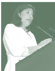
Sra. Ana Vilma Albanez de Escobar. Presidenta de la República en funciones

A continuación se presenta los discursos de bienvenida que fueron pronunciados durante el acto de inauguración en el auditorium de FEPADE el 25 de octubre de 2006.