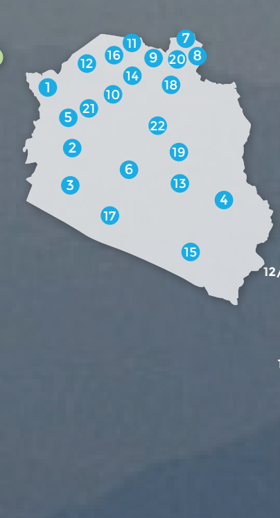
La Paz (LP)