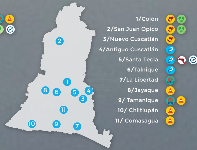
La Libertad (LL)