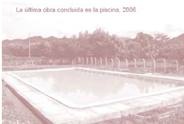
La última obra concluida es la piscina, 2006