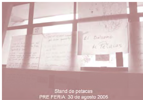
Stand de petacas PRE FERIA: 30 de agosto 2006