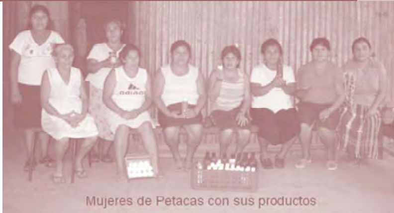
Mujeres de Petacas con sus productos