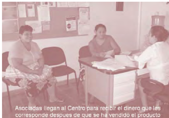
Asociadas llegan al Centro para recibir el dinero que les corresponde despues de que se ha vendido el producto