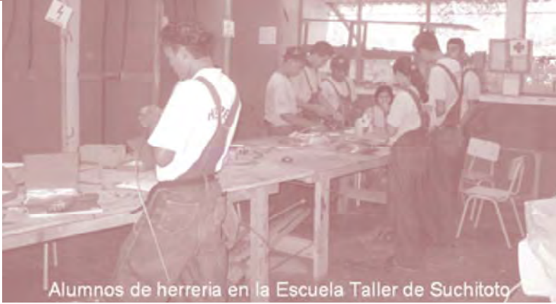
Alumnos de herrería en la Escuela Taller de Suchitoto