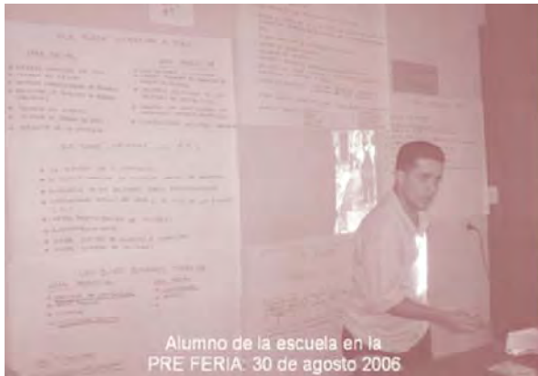
Alumno de la escuela en la PRE FERIA. 30 de agosto 2006

proporciona el INSAFORP, las instalaciones CONCULTURA y los gastos de mantenimiento, herramientas, y personal administrativo es proporcionado por AECI. Para los alumnos lo más importante que han aprendido en la Escuela, aparte del oficio específico es que el trabajo los aleja de los problemas sociales (maras) y que con su profesión pueden mejorar su calidad de vida y ser un ejemplo en su comunidad. Para mejorar la Escuela Taller podría difundir más su experiencia, lograr el auto sostenimiento financiero y apoyar en la inserción laboral de los egresados. Entre los posibles socios identificados están las gremiales de la construcción, instituciones públicas y de financiamiento.