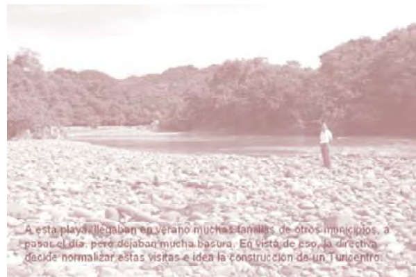
A esta playa llegaban en verano muchas familias de otros municipios, a pasar el día, pero dejaban mucha basura. En vista de eso, la directiva decide normalizar estas vistas e idea la construcción de un Turicentro.