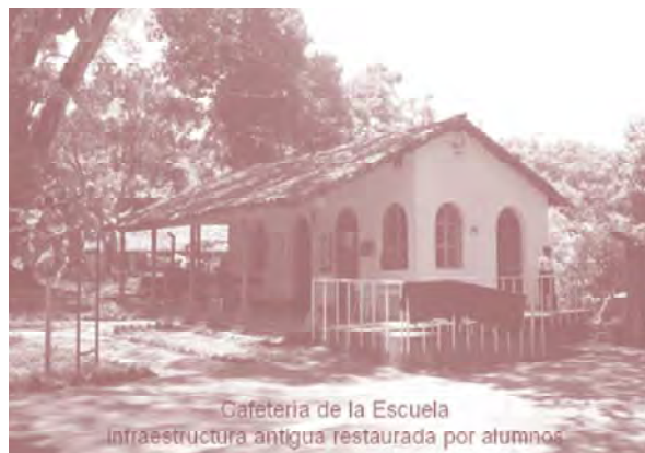
Cafetería de la Escuela Infraestructura antigua restaurada por alumnos