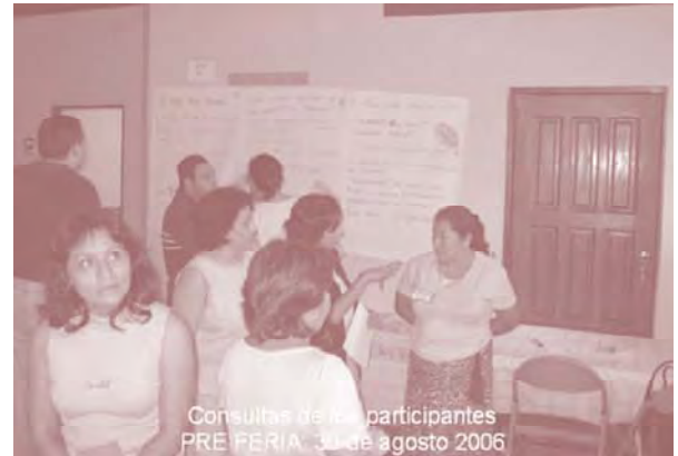
Consultas de las participantes PRE FERIA: 30 de agosto 2006