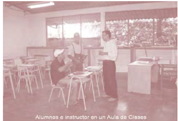
Alumnos e instructor en un Aula de Clases