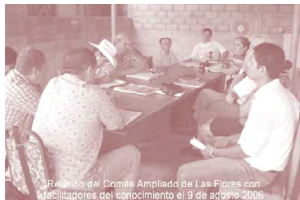
Reunión del Comité Ampliado de Las Flores con facilitadores del conocimiento el 9 de agosto 2006