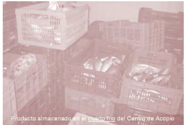
Producto almacenado en el cuarto frío del Centro de Acopio