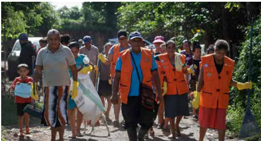
Comunidades de Puerto El Triunfo, en la Bahía de Jiquilisco, se suman a labores de limpieza y descontaminación de ríos y zonas aledañas a humedales.

La herramienta busca contribuir a una mejor gestión local y nacional de estos ecosistemas, especialmente de los humedales protegidos de importancia internacional (HPII) o sitios Ramsar, que además de ser muy relevantes en la lucha contra el cambio climático, son fundamentales como fuentes de actividad económica para las familias, y contribuyen a la seguridad alimentaria y la reducción de la pobreza.