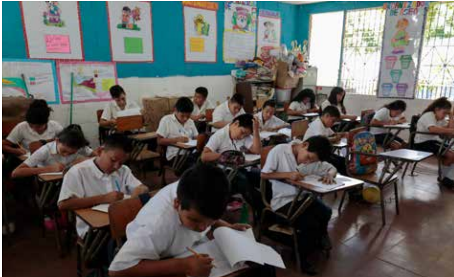
Apoyamos al Ministerio de Educación en el Sistema de Alerta de Violencia en Educación (SALVE), que busca prevenir y responder a hechos de violencia en las escuelas.

En seguridad ciudadana, una de las innovaciones a las que contribuimos en 2019 fue el desarrollo del Sistema de Alerta de Violencia en Educación (SALVE), que busca fortalecer la efectiva respuesta interinstitucional a eventos de violencia críticos y urgentes en las escuelas públicas en El Salvador.