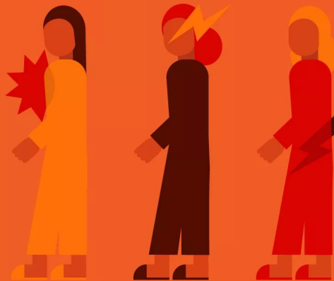
Physical | Psychological | Sexual