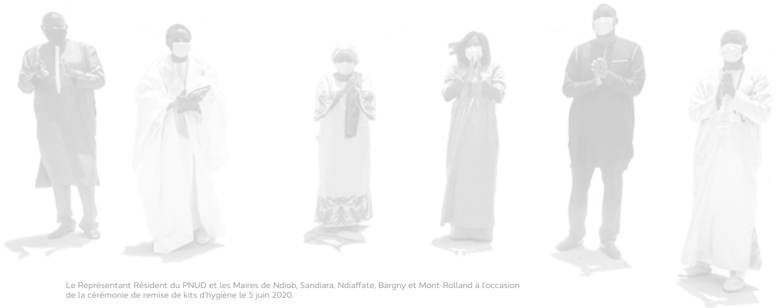
Le Représentant Résident du PNUD et les Maires de Ndiob, Sandiara, Ndioufate, Bargny et Mont-Rolland à l'occasion de la cérémonie de remise de kits d'hygiène le 5 juin 2020.

Le plan communal de riposte de Ndiob, assorti d'un important volet de communication sociale, est conçu pour les acteurs locaux comme un outil complet, fédérateur et mobilisateur pour la prévention et la gestion de la pandémie, au niveau territorial. Il constitue un outil important de relance des économies locales, pour une décentralisation effective des politiques publiques, afin de soutenir l'Agenda 2030.