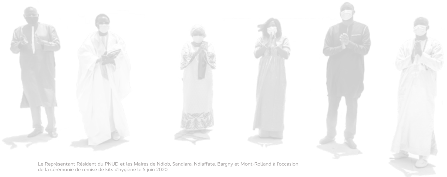
Le Représentant Résident du PNUD et les Maires de Ndiob, Sandiara, Ndiaffate, Bargny et Mont-Rolland à l'occasion de la cérémonie de remise de kits d'hygiène le 5 juin 2020.

Le plan communal de riposte de Mont-Rolland, assorti d'un important volet de communication sociale, est conçu pour les acteurs locaux comme un outil complet, fédérateur et mobilisateur pour la prévention et la gestion de la pandémie, au niveau territorial. Il constitue un outil important de relance des économies locales, pour une décentralisation effective des politiques publiques, afin de soutenir l'Agenda 2030.