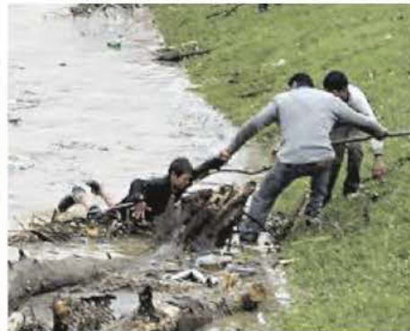
Насипи од врећа с песком (лево), спасавање дечака из набујале реке (десно)