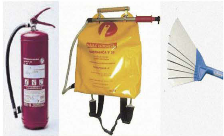
Средства за гашење пожара