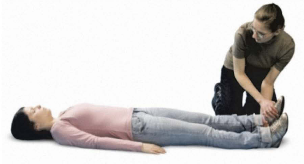
Провера повреде екстремитета

Проверите да ли особа осећа и може сама да покреће руке и ноге. Ако су покрети болни, немојте на њима инсистирати, већ нека се рука или нога задрже у затеченом положају, који је најмање болан за повређеног.