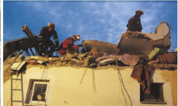
Припадници цивилне заштите у акцији