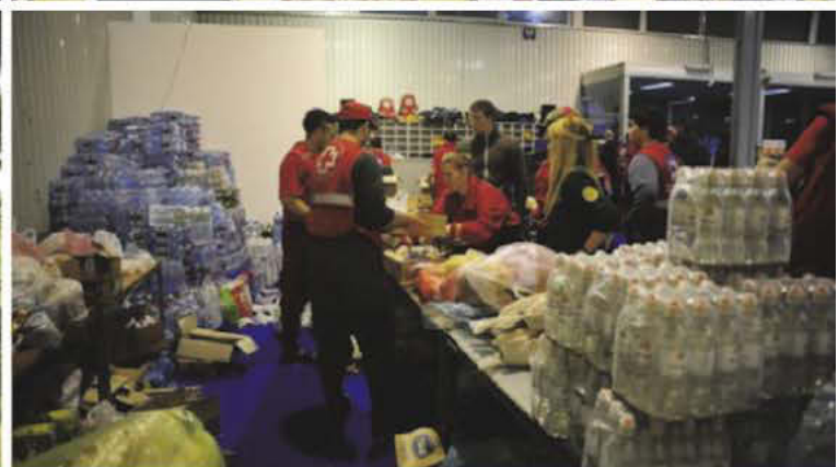
Примери збрињавања становништва