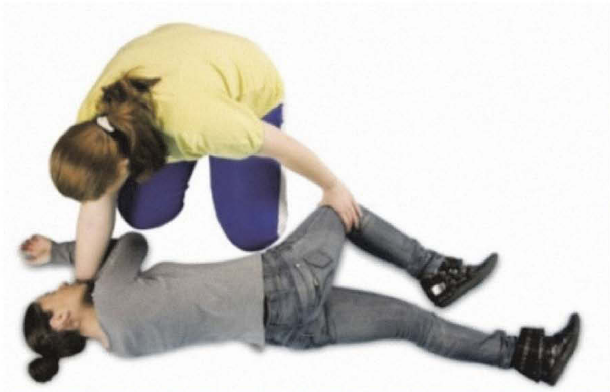
Постављање повређеног у бочни, релаксирајући положај