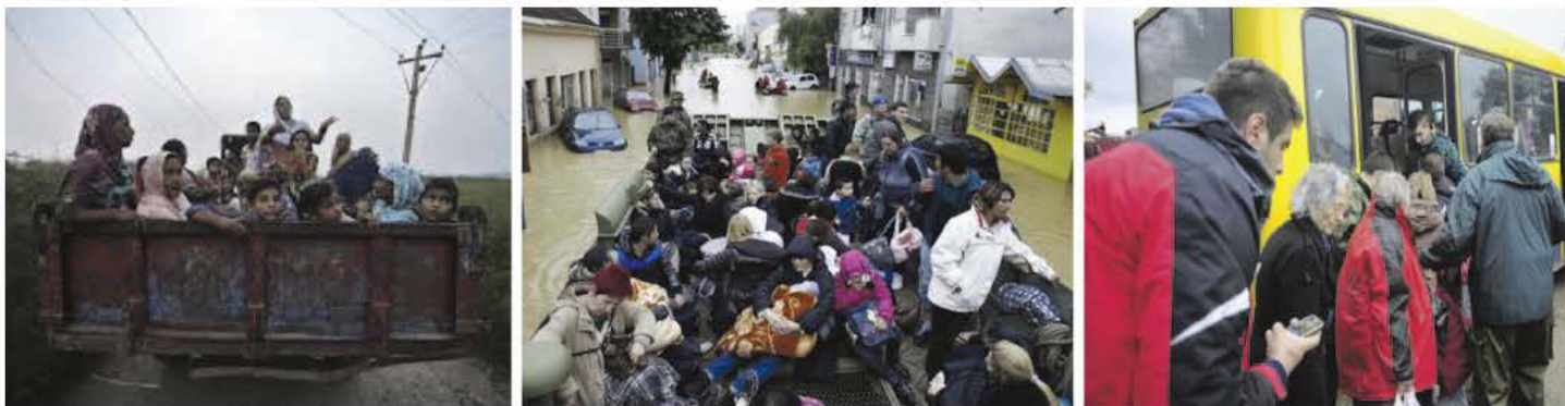
Евакуација становништва - поплава у Обреновцу 2014.

Такође је обавеза повереника цивилне заштите да у складу са препорукама надлежног штаба за ванредне ситуације, плански усмере и оне грађане који желе самостално да се евакуишу.