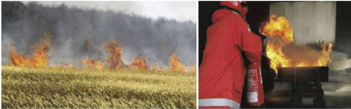
Пожар у пољу (лево), гашење пламена помоћу против-пожарног апарата (десно)