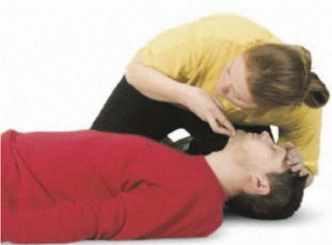
Провера да ли повређени дише

На сваком од наведених делова тела, треба обратити пажњу на следеће: