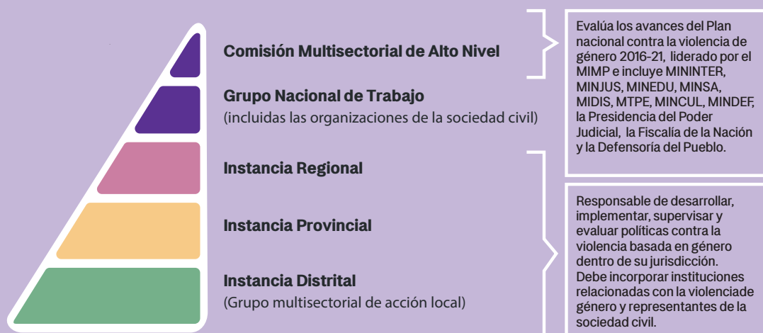
Figura 1. Sistema Nacional establecido bajo el marco de la Ley N.º 30364

El Perú tiene 1874 distritos (INEI, 2020) c , cada uno con el mandato bajo la Ley N.º 30364 de establecer una Instancia de Concertación para la prevención y erradicación de la violencia contra la mujer e integrantes del grupo familiar y la producción de 2 documentos clave: 1) el Plan de Acción de la Instancia de Concertación; y 2) el Protocolo Distrital para abordar la violencia contra las mujeres y los integrantes del grupo familiar. A principios del 2020, solo 28 de los 42 distritos de Lima han establecido una Instancia Distrital d . No obstante, una evaluación del 2019 del Plan Nacional Contra la Violencia de Género 2016-21 e señaló que la mayoría de las Instancias no son efectivas y recomienda fortalecer los programas que promueven la participación de sociedad civil en el monitoreo de políticas públicas y acciones estratégicas en la prevención, atención, protección y persecución de la VBG. Una evaluación del 2017 para fortalecer la aplicación de la Ley N.º 30634 recomendó recursos adicionales en el sector de justicia y la aplicación de la ley para mejorar y ampliar los servicios f .