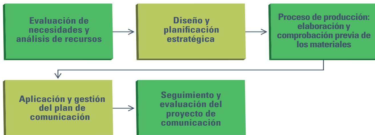
Figura 1. Pasos para crear una estrategia de comunicación

importa es que las acciones se dirijan a la consecución de las metas que establecieron (ONUMUJERES cita a Cowichan Women Against Violence Society, 2002, pág. 67).