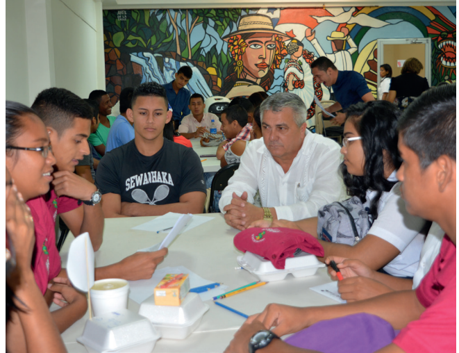
Proceso de consulta ciudadana, promovido por la Alcaldía de La Chorrera, con organizaciones juveniles

Así que la propuesta en materia de seguridad ciudadana de la Alcaldía, a través del establecimiento del presente Plan, velará para que los principios y consideraciones fundamentales se incorporen a una visión integral que refleje una atención prioritaria, tanto en los elementos estructurales de la violencia, como en las consecuencias concretas que se dependen de la actividad de los delincuentes, en amplias zonas de la población de La Chorrera.