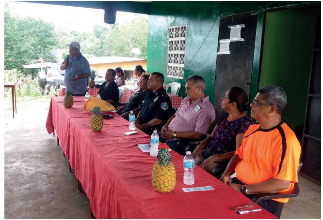
Jornadas de consultas en comunidades de La Chorrera

El presente Plan concentra sus acciones en esos territorios y en las modalidades delictuales mencionadas. Las estrategias y acciones concertadas con los actores que intervinieron en su desarrollo están centradas en