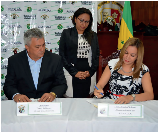
Firma del acuerdo de colaboración al Observatorio de Seguridad Ciudadana del municipio de La Chorrera

Los esfuerzos en el desarrollo de programas y acciones estratégicas, que se han impulsado en La Chorrera, están sustentados en la prevención y se han ido fortaleciendo como una herramienta eficaz para reducir de forma gradual la violencia y la intranquilidad ciudadana.