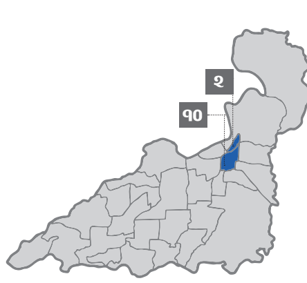
भरतपुर महानगरपालिका वडा नं २ ९०