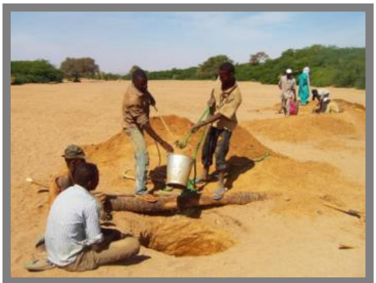
Creusement des puits de recharge des nappes phréatiques, Iférouane

Les 34 projets HIMO sont en cours d'exécution dans les quinze communes de la région. Dans ce cadre, une mission conjointe PNUD, HACP et services techniques régionaux d'Agadez, d'identification des travaux réalisables en HIMO, a été effectuée dans les 15 communes de la région d'Agadez du 6