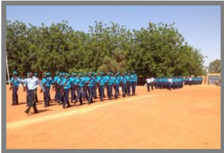
Parade des éléments de la police municipale à l'occasion des cérémonies de sortie, PNUD, Nov.2012

2012, puis formés à l'Ecole Nationale de Police et de la Formation Permanente de juillet à octobre 2012 (4 mois) et ont été mis à la disposition des communes. En plus un sous-officier des forces de défense et de sécurité a été affecté à chaque unité pour l'encadrement de ces policiers. C'est un précieux service de proximité qui permet de contenir et de lutter contre l'insécurité. Par ailleurs, c'est un renfort pour les autres forces de défense et de sécurité, qui pourront, désormais, s'appuyer sur les agents de la police municipale pour disposer d'information. La mise en place de cette police de proximité est très appréciée par les populations des communes rurales. Cependant, leur contribution à l'amélioration globale de la sécurité des biens et des personnes au niveau communal est difficile à évaluer compte tenu de leur diversité et de leur dispersion. La question du suivi, de l'entretien, de la chaîne de commandement et surtout de la pérennisation de cette police est à prendre en compte.