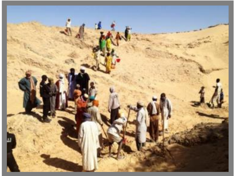
Désensablement des salines, Fachi

A l'issue de cette mission, 34 dossiers de projet ont été montés et validés pour l'ensemble des quinze communes d'Agadez. Des Lettres d'Accord (LOA) ont été signées avec les différentes mairies pour la mise en œuvre des projets. Dans le cadre des lettres d'accord, les communes ont la responsabilité de mettre en place leurs différents comités de suivi et de gestion des projets (le comité communal de gestion des projets, le comité de gestion du site/chantier, et le comité ad hoc de passation des marchés). Des comités de suivi technique et de contrôle de qualité ont été mis en place au niveau régional et départemental.