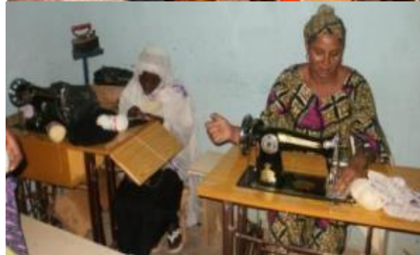
Centre de formation professionnelle de Tchirozerine, filière électrique et couture, Mai 2013