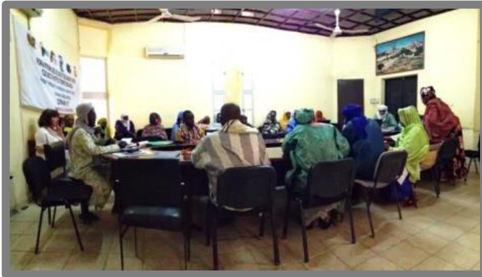
Formation des élus locaux session « genre, paix et développement », mai 2013, Agadez

121 élus (dont 40 femmes) ont bénéficié des formations suite à une lettre d'Accord signée entre le PNUD et l'ENAM. La formation s'est déroulée du 6 au 18 mai 2013 dans la salle de réunion du Gouvernorat d'Agadez sous forme de quatre sessions. Chaque session a duré trois jours, avec des cibles différentes et des modules propres. La presse nationale publique et privée a couvert l'événement.