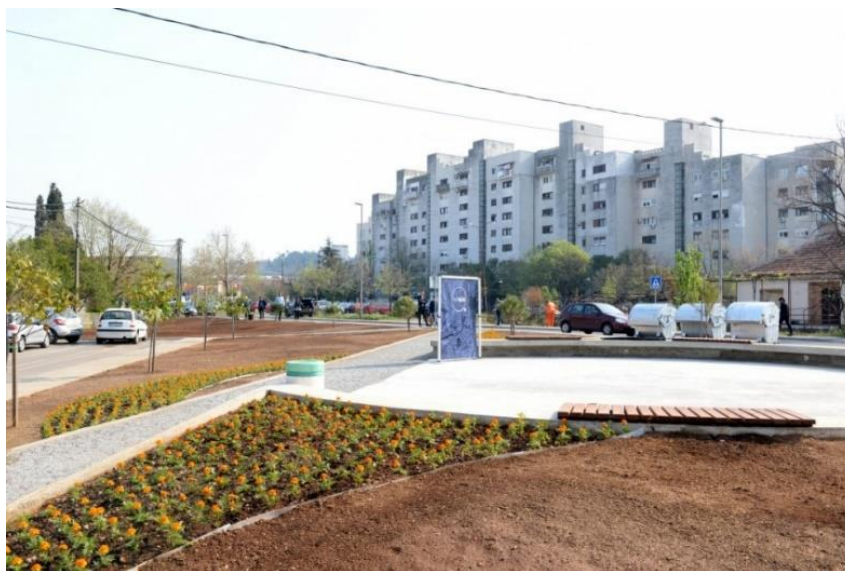
Fotografija 4. Predmetna lokacija – Skver Princeze Ksenije

Opis lokacije: Lokacija skvera je na uglu Ulice princeze Ksenije i Ulice Joza Vukčevića u Podgorici.