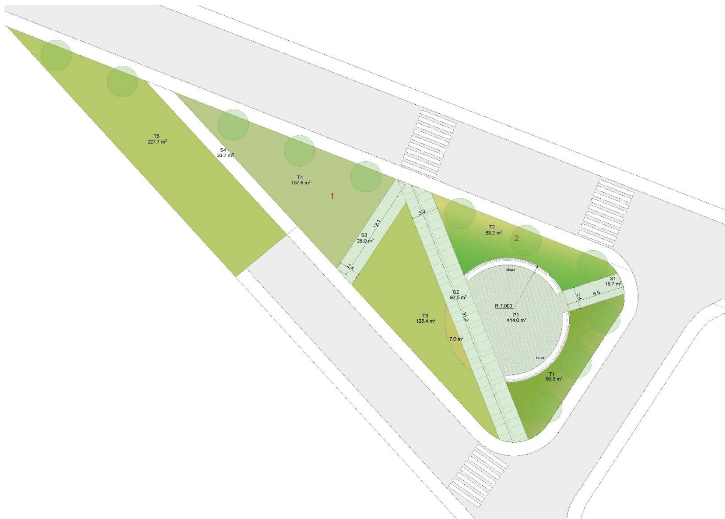
Slika 5. Situacioni prikaz skvera Princeza Ksenija