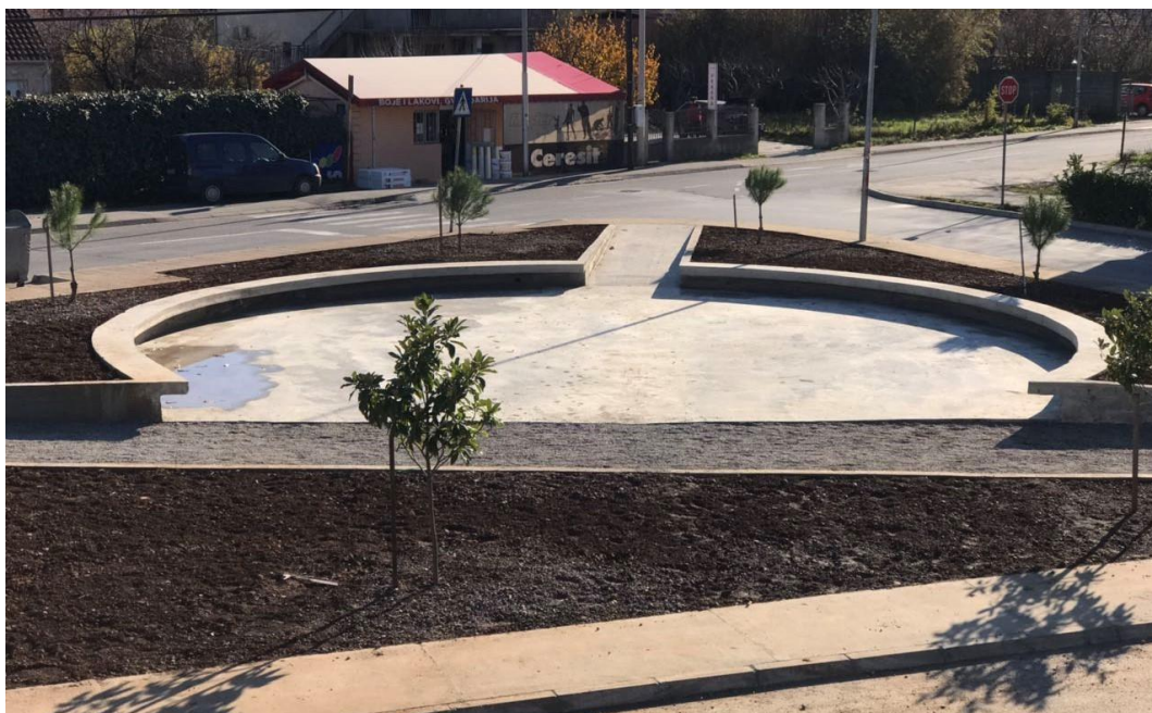
Fotografije 2 i 3. Predmetna lokacija – Skver Princeze Ksenije