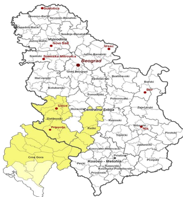
Slika 1: Oblasti koje ispunjavaju uslove za učešće i susjedne oblasti za IPA Program prekogranične saradnje Srbija-Crna Gora

Ostali konkursi i programi će biti dostupni u okviru IPA II (2014–2020) programa.