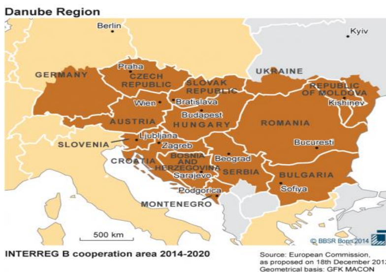
Slika 2: Područje za saradnju u dunavskom regionu

Dunav 2014-2020. je instrument Evropske unije za poboljšanje procesa teritorijalne, ekonomske i društvene integracije kroz razvoj transnacionalnih partnerstava u oblastima koje su od strateškog značaja i doprinose koheziji, stabilnosti i konkurentnosti dunavskog regiona. Ovaj region obuhvata 14 zemalja: Austrija, Bugarska, Hrvatska, Češka, Mađarska, Njemačka (Baden-Virtemberg i Bavarska), Rumunija, Slovačka, Slovenija, Bosna i Hercegovina, Moldavija, Crna Gora, Srbija i Ukrajina. Ukupni programski budžet iznosi 273,28 miliona EUR.