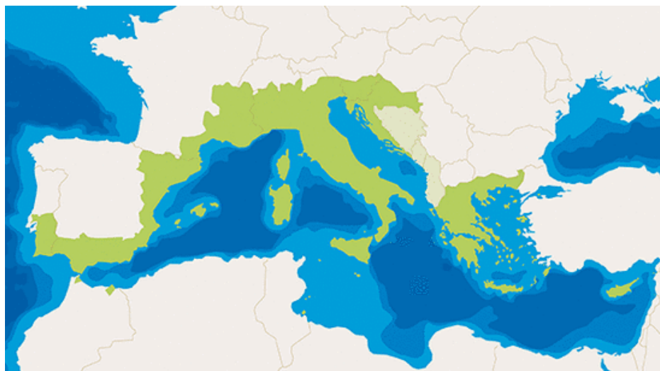
Slika 4: područje MED programa

Sa budžetom većim od 250 miliona EUR (od kojih je 193 mil. EUR iz ERDF), u okviru programa će se obezbijediti sredstva, do isteka ERDF paketa, za konkurse za projekte kako bi se obezbijedila međunarodna partnerstva za postizanje ciljeva programa za mediteransko područje.