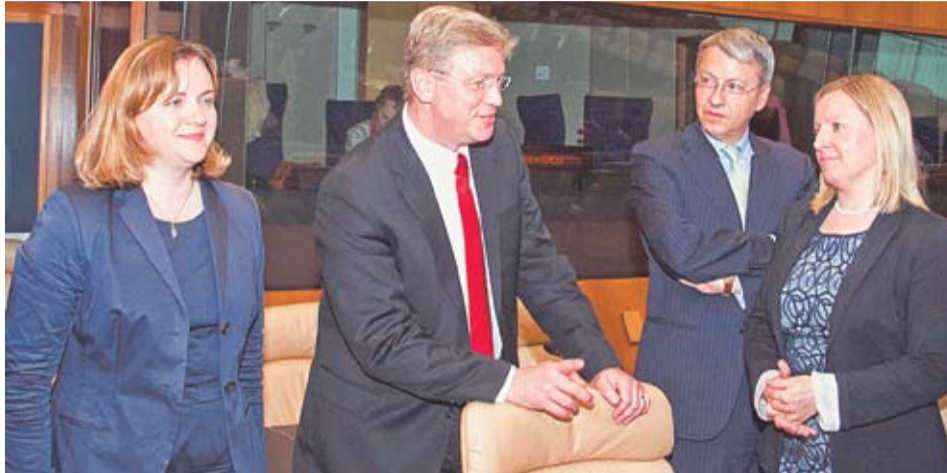
De la stânga la dreapta: Dna Natalia Gherman, ministrul Afacerilor Externe și Integrării Europene al Republicii Moldova; Dl Stefan Fule, membru al Comisiei Europene; Dna Lucinda Creighton, ministrul irlandez de stat pentru afaceri europene.

— Înainte de toate, voi spune că Acordul este obligatoriu, din punct de vedere juridic, pentru ambele părți și, dacă nu e respectat, poate fi declanșat mecanismul de soluționare a disputelor pentru neonorarea obligațiilor