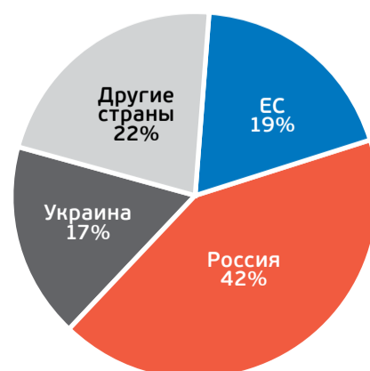
Фигура 4. Структура импорта приднестровского региона, 2013