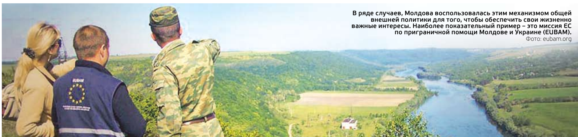
В ряде случаев, Молдова воспользовалась этим механизмом общей внешней политики для того, чтобы обеспечить свои жизненно важные интересы. Наиболее показательный пример – это миссия ЕС по приграничной помощи Молдове и Украине (EUBAM).