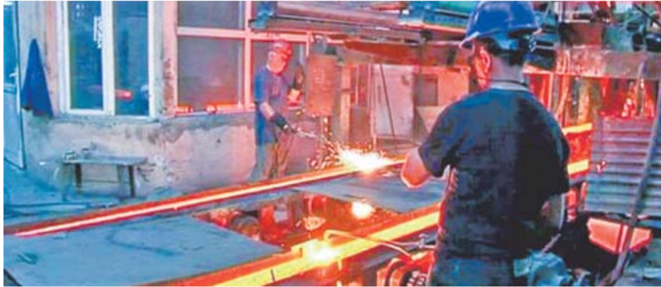
Соглашения с Европейским союзом позволят компаниям из бывших советских республик вести свободную торговлю в любом из 28 государств-членов ЕС без дополнительных сборов или ограничений, при условии, что товары соответствуют стандартам ЕС.

Во-вторых, по наиболее чувствительным товарам либерализация импорта останется только частичной. Принимая во внимание особенности молдавской экономики и уязвимость отдельных агропродовольственных отраслей, были установлены количественные квоты по импорту такой продукции в Евросоюз без уплаты таможенных пошлин. Так, для импорта такой продукции сверх квот, закрепленных в Соглашении, будут применяться протекционистские