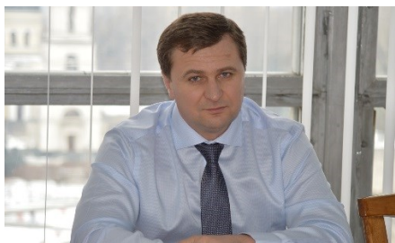
Sergiu Palihovici Secretarul general adjunct al Guvernului Republicii Moldova

„Anul 2014 va fi un an record în ceea ce privește oportunitățile de investiții la nivel local, atât din bugetul de stat cât și din alte surse și fonduri aferente: Fondul rutier, Fondul ecologic, Fondul de eficiență energetică, Fondul de dezvoltare regională, și altele. În anul 2014, ne propunem să realizăm în practică sloganul ‘țara în șantier de construcție și dezvoltare’.”