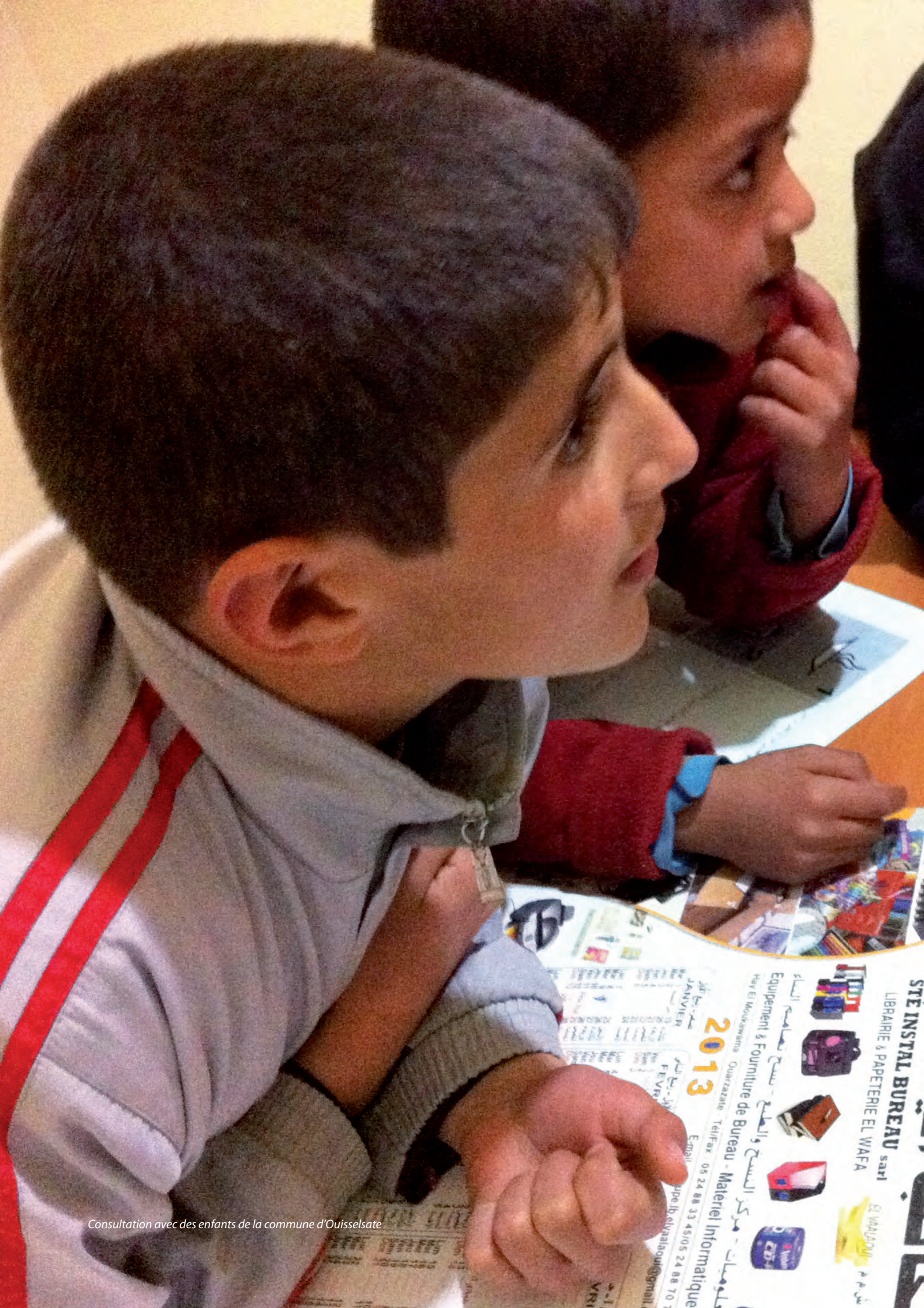
Consultation avec des enfants de la commune d'Ouisselsate