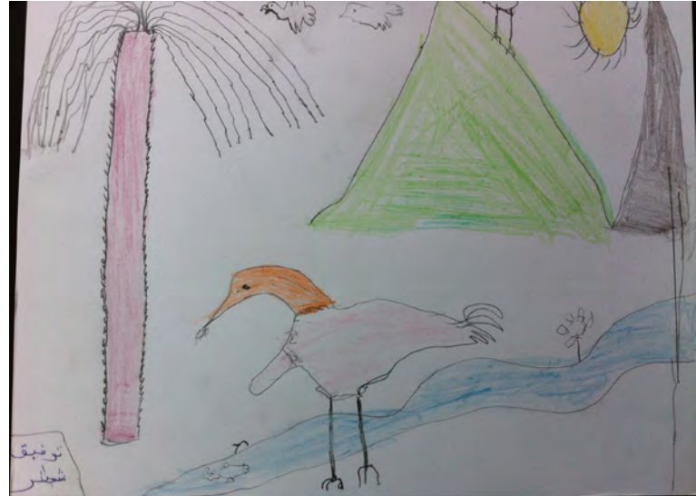
Consultation avec des enfants de la commune d'Ouisselsate, le 23 février 2013

Les préoccupations exprimées par les participants aux consultations montrent que la protection de l'environnement concerne la qualité de vie et la transmission des valeurs aussi bien que la préservation du patrimoine naturel. Des préoccupations concernant l'assainissement, la collecte des ordures et le recyclage des déchets sont couplées à des attentes sur les "écoles écologiques", les énergies renouvelables, le reboisement et l'aménagement d'espaces verts pour les loisirs ("planter des arbres et les conserver", comme l'exprime un groupe d'enfants).