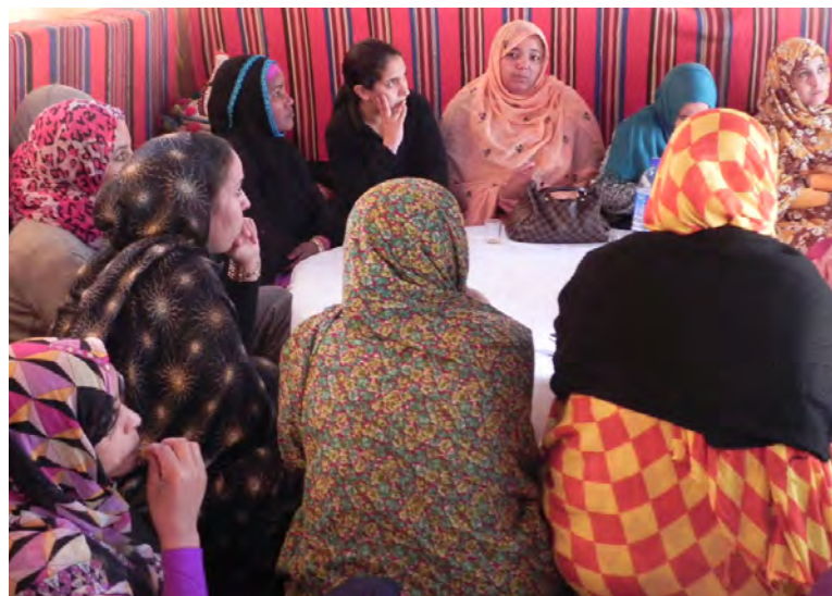
Consultations avec des femmes élues, le 23 mars 2013

Au-delà du contrôle démocratique, les consultations montrent également que les Marocains aspirent à une plus grande participation aux processus de décision. Un parlementaire résume cette aspiration : "Il y a un grand besoin en matière de coopération et de démocratie en partenariat avec la société civile pour que le développement soit possible. [...] On a besoin de communication et d'une démocratie participative" . La participation et le contrôle vont de pair pour que les droits sociaux de tous (des femmes, des populations rurales, des personnes en situation de handicap, etc.) soient pris en considération dans les politiques publiques.