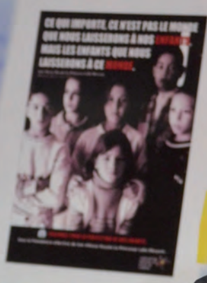
Consultation avec des enfants parlementaires

- الخطبة الصحيحة لجميع الأعمار - حماية التطبيب - التكامل التام بيني الاحتياجات الخاصة - توفير الخدمات الطبية بالمنطقة الثانية - توفير خدمات الأطفال والرفع - توفير نسبة وفيلك الأطفال المستعينة - توفير النتائج الأثرية المستعينة - رعاية العمر المعدل - إعطاء التعليم للأشخاص ذوي الإعاقة مع مواهب - ضمان حقوق الأهل بشكل متكامل - توفير الأهل - التشجيع على الإبداع - إدراج مادة التنمية الذاتية ضمن المنهجية التربوية - توفير مكتبة لكل حي ودراسة الثقافة - توفير الأشياء والحز