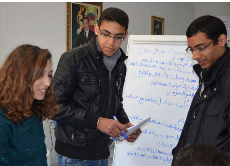
Consultation avec des enfants parlementaires, le 9 février 2013

Les Marocains rêvent d'une couverture médicale globale et gratuite, et quelques uns désirent la fin des monopoles au sein de l'industrie pharmaceutique. Les participants aux consultations préconisent l'augmentation des allocations budgétaires pour le secteur, de mettre l'accent sur la réduction de la mortalité infantile et la santé des femmes, ainsi que sur la production des médicaments génériques,