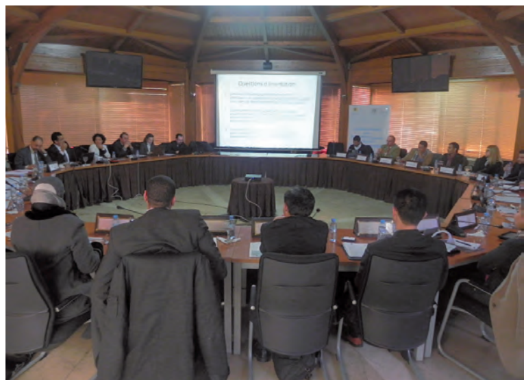
Consultation avec des représentants des missions diplomatiques, le 22 février 2013

Le renforcement de l'intégration régionale et de la coopération Sud-Sud permettrait de partager les expériences et de capitaliser le savoir-faire des pays.