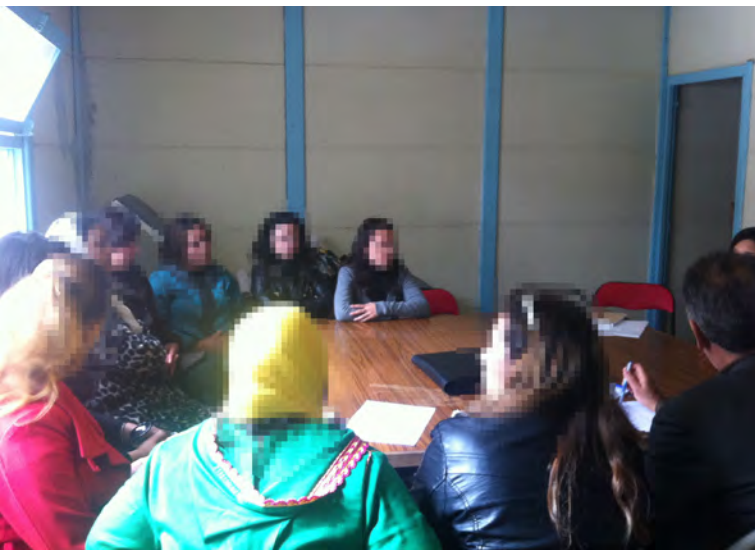
"Focus Group" - Personnes vulnérables

Il convient aussi de sensibiliser les enfants sur leurs droits, de sensibiliser les populations sur la gravité de l'exploitation des enfants et de lutter contre la participation des enfants dans les guerres.