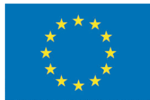
This project is co-funded by the European Union