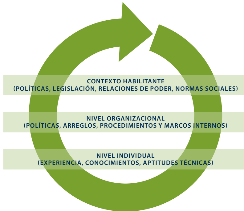
FIGURA 2: ENFOQUE SISTÉMICO DEL PNUD AL DESARROLLO DE CAPACIDADES