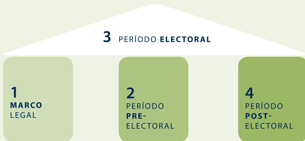
FIGURA 3: CONSTRUYENDO BASES SÓLIDAS PARA LA PARTICIPACIÓN ELECTORAL

de la discusión inicial de marcos legales se presentan puntos de entrada destacados en cada una de las tres fases del ciclo electoral. Se enfatizan las intervenciones estratégicas en los períodos pre- y post-electorales que sientan bases sólidas para mejorar la participación de la juventud en la fase electoral (ver Figura 3).