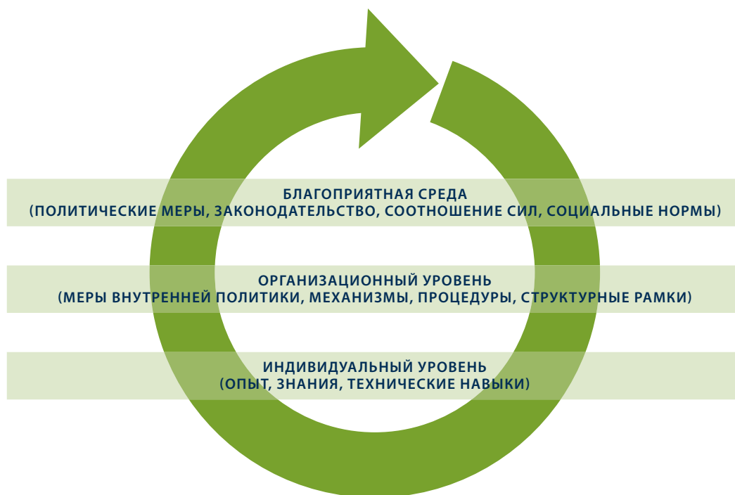
РИСУНОК 2. СИСТЕМНЫЙ ПОДХОД ПРООН К РАЗВИТИЮ ПОТЕНЦИАЛА

Развитие потенциала может стать неотъемлемым элементом любой стратегии осмысленного участия в политической жизни. Подход ПРООН к развитию потенциала «отражает точку зрения, согласно которой этот потенциал существует на уровне отдельных индивидов, а также организаций и благоприятной среды. 15 Три вышеперечисленных уровня образуют интегрированную систему, 16 как показано на Рис. 2.