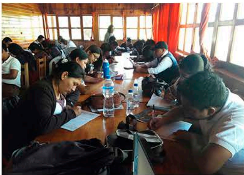
Grupo de Chajul, recibe el curso de Lactancia Materna.