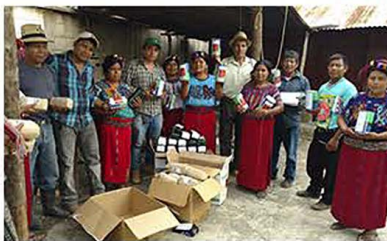
Entrega de semillas a promotores, con observación y visto bueno de autoridades comunitarias. Villa Hortensia, Cotzal y Chel, en Chajul. Abril 2017

Al la fecha en el área Ixil se están reproduciendo plantas originarias en la región como el tomate de árbol, hierba mora, hierba blanca, chile de caballo, güisquil entre otras, las cuales que aportarán a la seguridad alimentaria y nutricional.