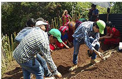
Establecimiento de huertos familiares en Ilom y Chel en el municipio de Chajul.

Al la fecha en el área Ixil se están reproduciendo plantas originarias en la región como el tomate de árbol, hierba mora, hierba blanca, chile de caballo, güisquil entre otras, las cuales que aportarán a la seguridad alimentaria y nutricional.