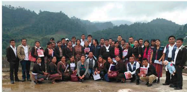
Grupo de Cotzal, en Clausura del Curso Lactancia Materna en Cotzal.