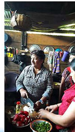
Capacitación a mujeres en buenas prácticas de manipulación y elaboración de alimentos. Xonca y Pulay, municipio de Nebaj. Mayo 2017