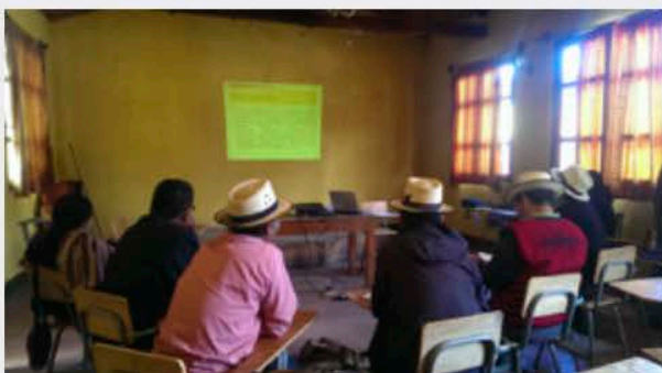
Presentación de ideas y estructuración de la visión y misión del Consejo de Autoridades Indígenas y Ancestrales.