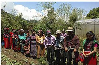
Gira de intercambio, visita al CADER Domingo Gómez Cavinal, Vichibala, Cotzal. Foto: José Itzep · PC-Ixil Mayo 2017

Acciones como las descritas anteriormente aportan al logro de los ODS 1, 2 y 3; Fin de la Pobreza, Hambre Cero y Salud y Bienestar.