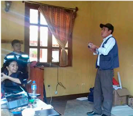
Encargado de Puesto de Salud explica el «buen agarre del pecho» para una buena lactancia materna.

Con estos cursos se pretende garantizar que la mayoría de comunidades están cubiertas por medio de una consejería adecuada. La lactancia materna reduce la mortalidad infantil y tiene beneficios sanitarios que llegan hasta la edad adulta. La lactancia materna es a la vez un acto natural y un comportamiento que se aprende.