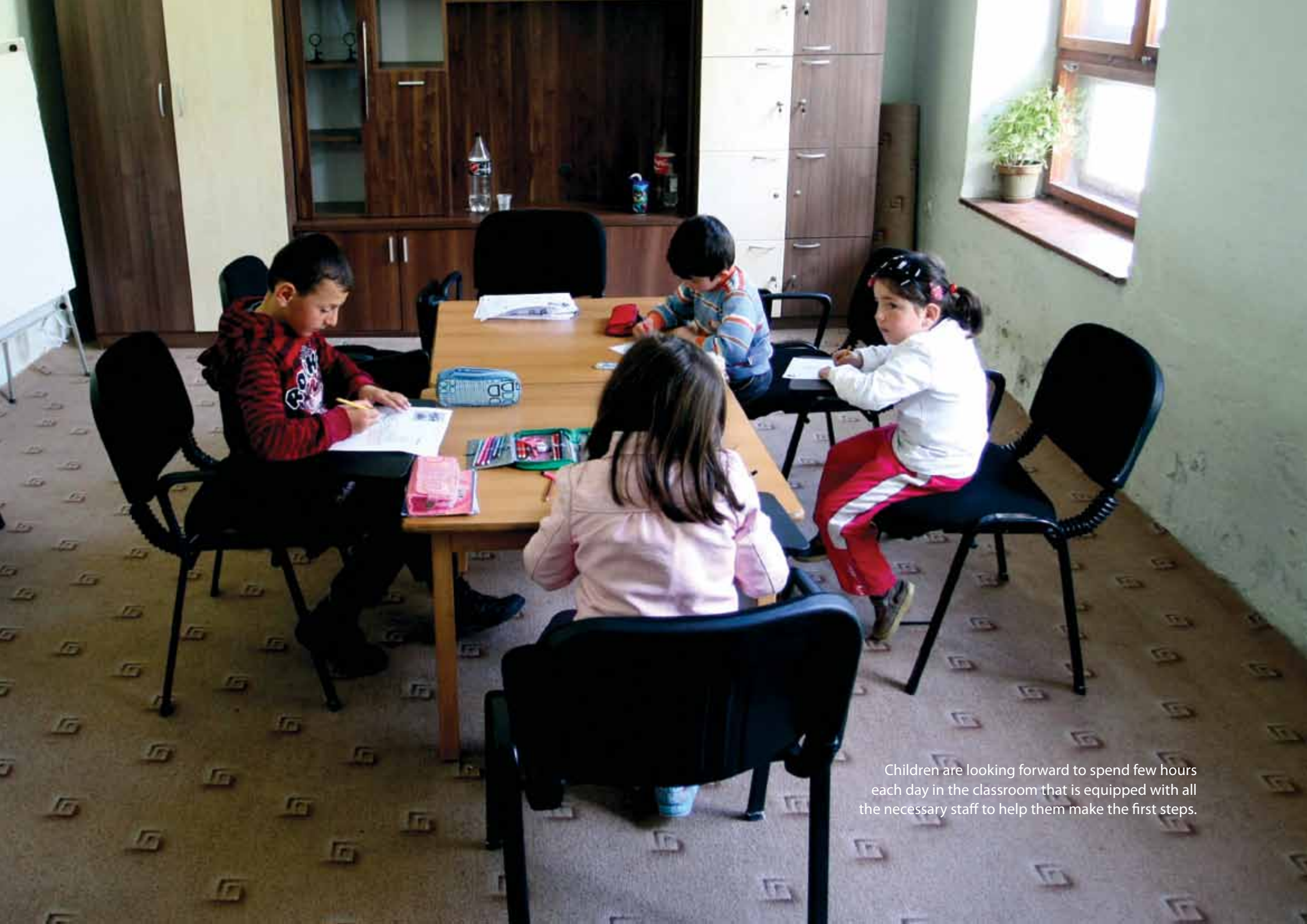
Children are looking forward to spend few hours each day in the classroom that is equipped with all the necessary staff to help them make the first steps.