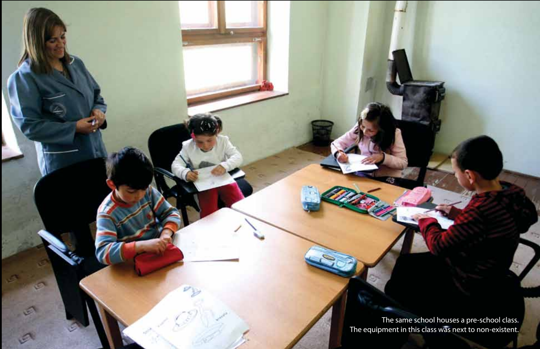
The same school houses a pre-school class. The equipment in this class was next to non-existent.