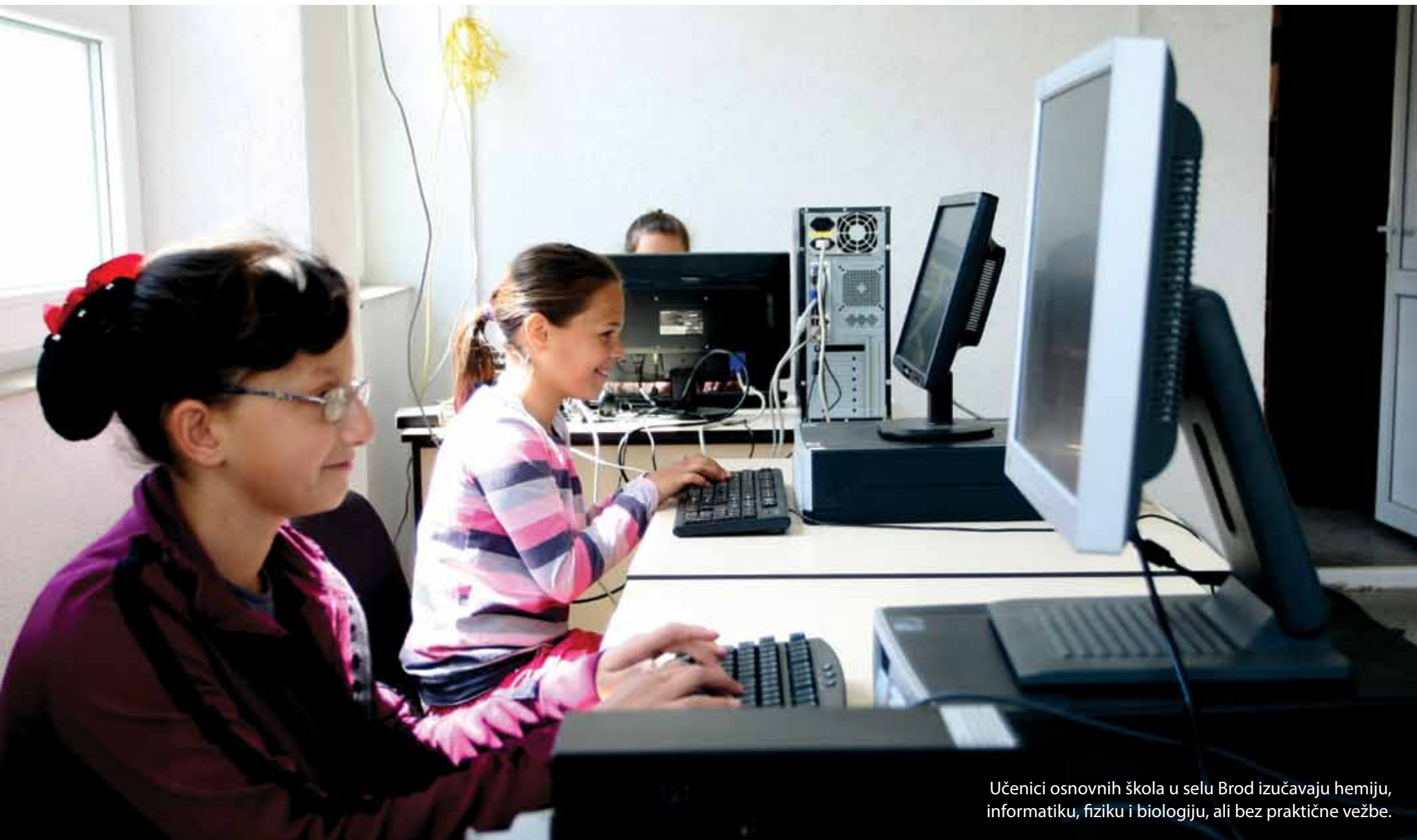
Učenci osnovnih škola u selu Brod izučavaju hemiju, informatiku, fiziku i biologiju, ali bez praktične vežbe.