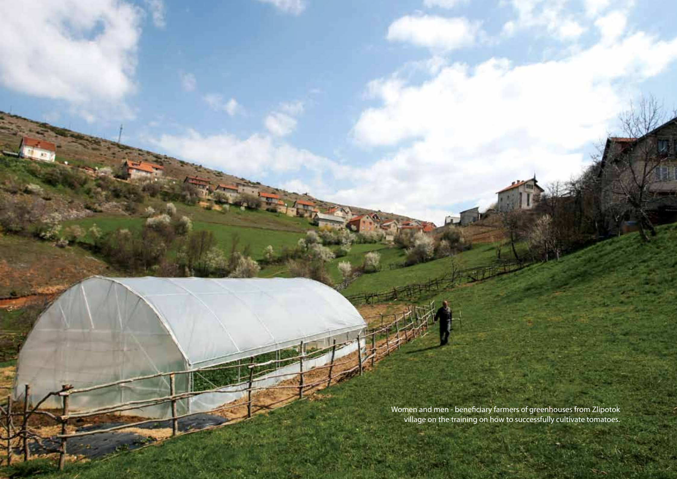
Women and men - beneficiary farmers of greenhouses from Zlipotok village on the training on how to successfully cultivate tomatoes.