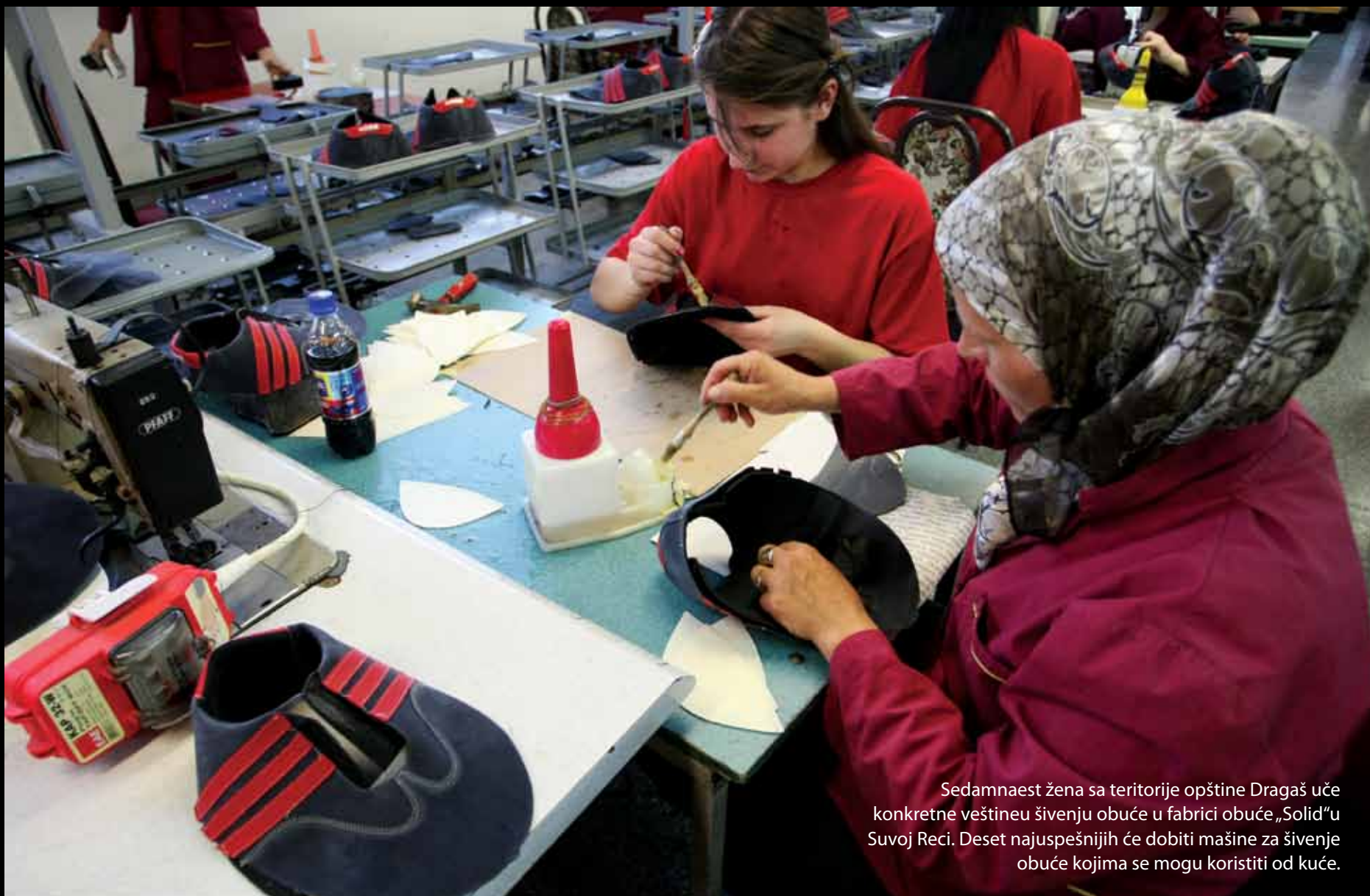
Sedamnaest žena sa teritorije opštine Dragaš uče konkretne veštine šivenju obuće u fabrici obuće „Solid“ u Suvoj Reci. Deset najuspešnijih će dobiti mašine za šivenje obuće kojima se mogu koristiti od kuće.