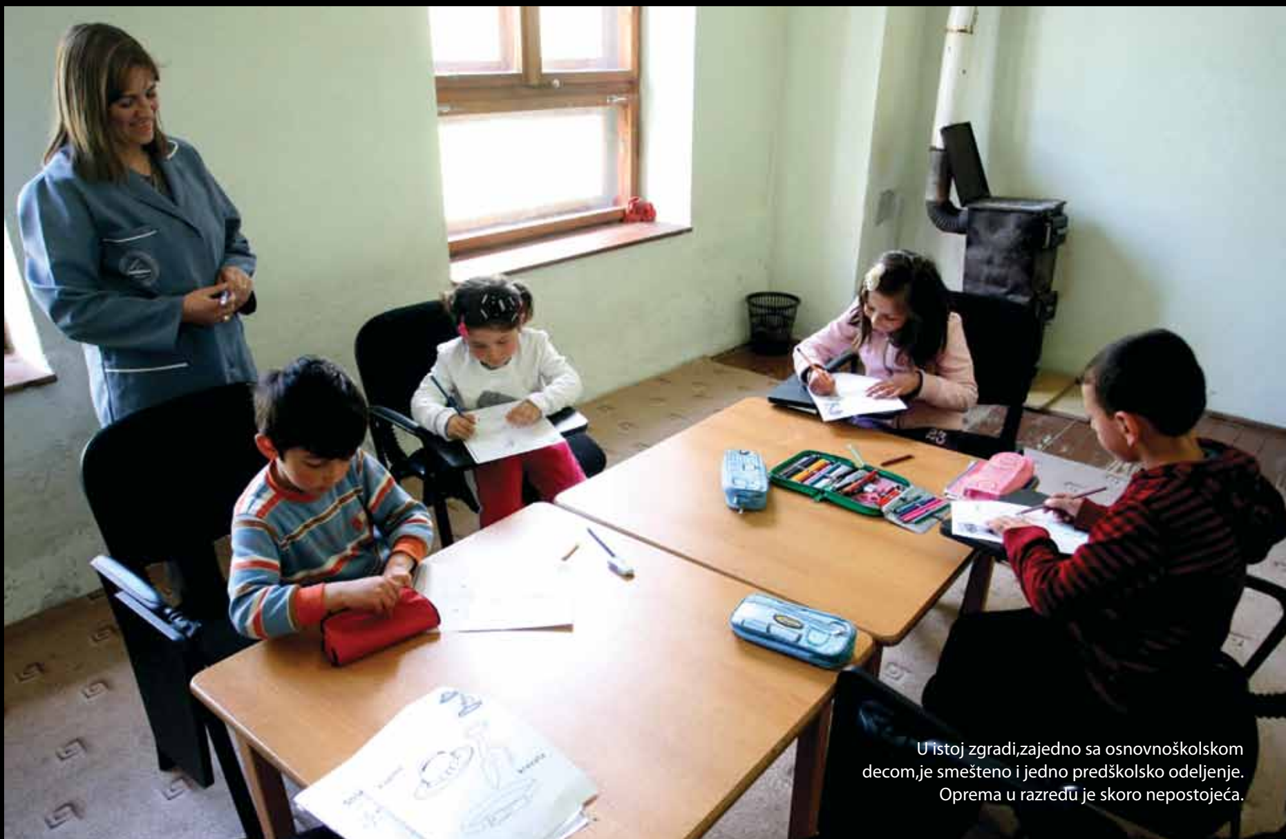
U istoj zgradi, zajedno sa osnovnoškolskom decom, je smešteno i jedno predškolsko odeljenje. Oprema u razredu je skoro nepostojeća.