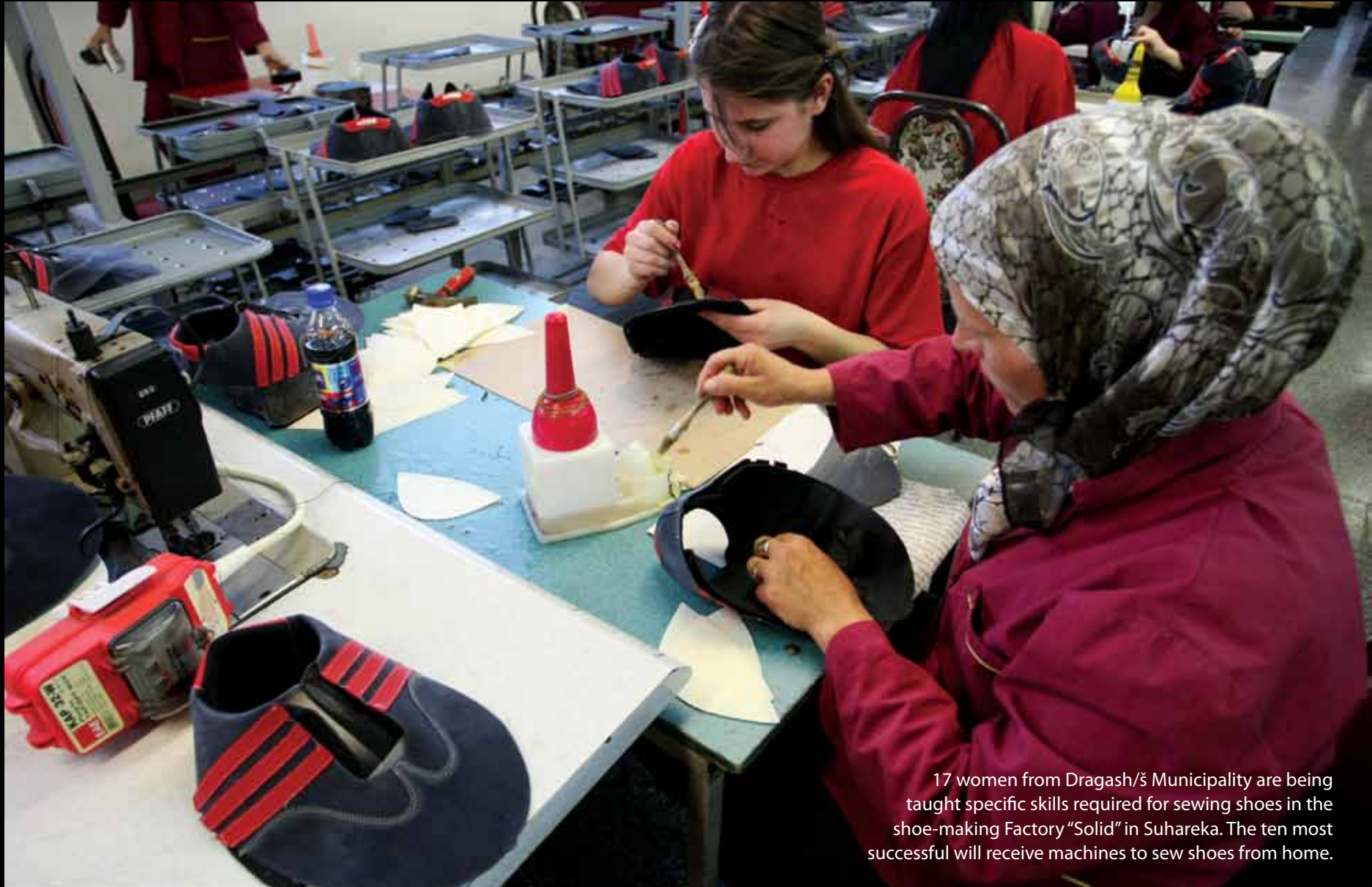
17 women from Dragash/š Municipality are being taught specific skills required for sewing shoes in the shoe-making Factory "Solid" in Suhareka. The ten most successful will receive machines to sew shoes from home.