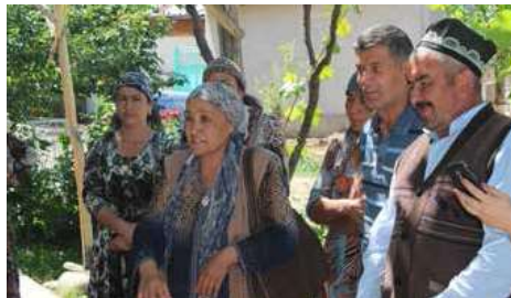
ВНЕДРЕНИЕ ГЕНДЕРНЫХ АСПЕКТОВ В ПОЛИТИКУ РАЗВИТИЯ ВОДОСНАБЖЕНИЯ СЕЛЬСКИХ НАСЕЛЕННЫХ ПУНКТОВ КЫРГЫЗСКОЙ РЕСПУБЛИКИ