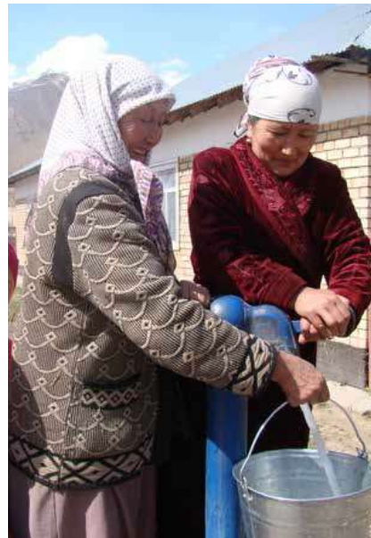
ВНЕДРЕНИЕ ГЕНДЕРНЫХ АСПЕКТОВ В ПОЛИТИКУ РАЗВИТИЯ ВОДОСНАБЖЕНИЯ СЕЛЬСКИХ НАСЕЛЕННЫХ ПУНКТОВ КЫРГЫЗСКОЙ РЕСПУБЛИКИ

Таким образом, гендерная ориентированность управленческих решений в сфере питьевого водоснабжения в сельской местности, основанная на дезагрегированных по полу данных, внедрение принципа гендерного равенства, и, в особенности, учет нужд сельских женщин и девочек, должны стать необходимыми элементами политик на всех этапах. Следовательно, гендерные аспекты должны быть приняты во внимание начиная со стадии планирования, заканчивая контролем исполнения, а сами сельские женщины должны быть равноправными участниками всех процессов управления. Только в этом случае - через достижение гендерного равенства - можно добиться устойчивого развития. Для этого гендерная составляющая должна быть учтена при выявлении проблемы, которую предстоит решить, постановки гендерно-специфичных целей и задач, определении мер/действий, определении гендерно-специфичных индикаторов мониторинга и оценки, определении ресурсов.