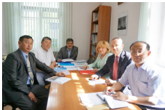
Участники миссии ВОЗ

В результате данной Миссии будет подготовлен технический отчет и рекомендации Региональному директору ЕВРО ВОЗ, а затем Генеральному директору ВОЗ.