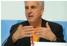
Г-н Мишель Казачкин