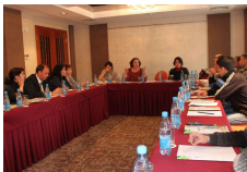
Миссия Глобального Фонда во время встречи с субреципиентами