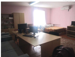
Центр по предоставлению услуг для ЛЖВ

Вопрос: с какими сложностями вы встречались в ходе реализации грантов Глобального Фонда?