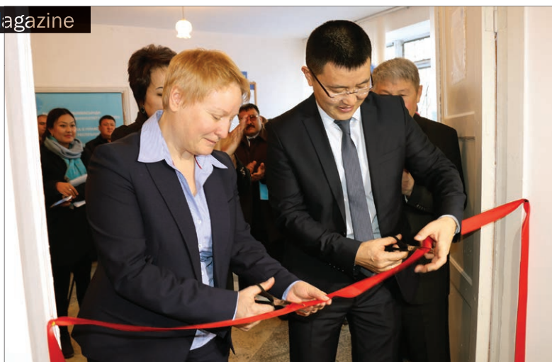
Церемония открытия центра правовой помощи в г. Токмок

По инициативе МЮ и при содействии проекта между LBD Consulting и областными управлениями МЮ по Чуйской и Ошской области заключены меморандумы о сотрудничестве в соответствии в которыми координаторы ГГЮП и юристы LBD Consulting дополняют друг друга в вопросах представительства интересов уязвимых групп населения по гражданским и уголов-