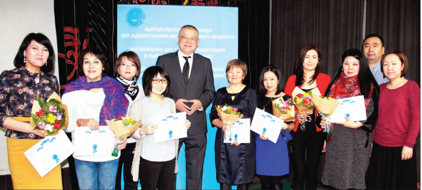
Журналисты были награждены в номинациях: "Пресса", "ТВ", "Радио", "Интернет-издания".