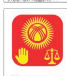
ГПК Кыргызской Республики