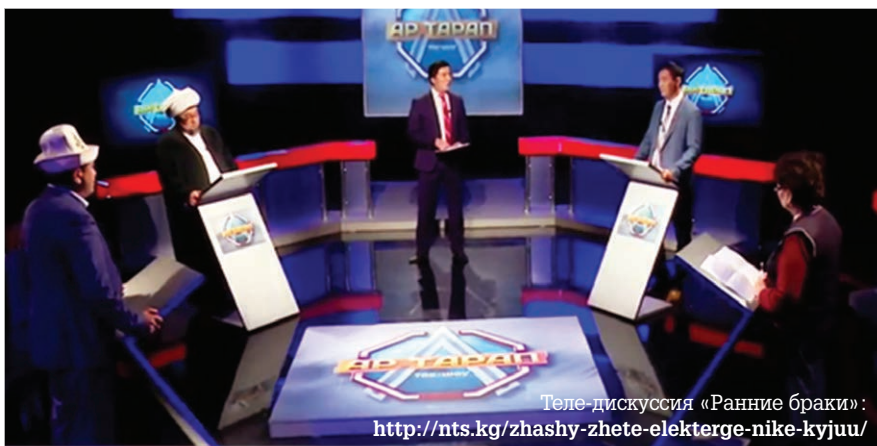
Теле-дискуссия «Ранние браки»: http://nts.kg/zhashy-zhete-elekterge-nike-kyjuu/

“В последнее время в стране участились случаи, когда несовершеннолетних девочек вынуждают вступать в брак путем обряда «нике». Только в прошлом году, около 1000 девочек стали матерями, аборт сделали 170 несовершеннолетних девочек. Предлагаемый законопроект является необходимым механизмом для решения проблемы” - отметила Вице-премьер-министр КР