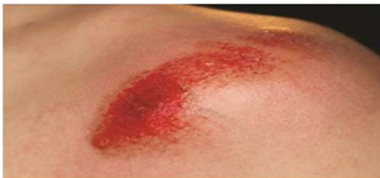
Рис.2. Ссадина с подсохшим дном буровато-красного цвета, расположенным на уровне кожи (6–12 часов).