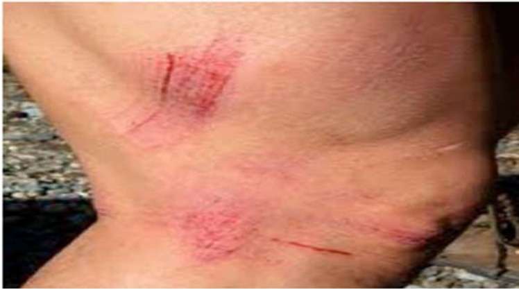
Рис. 3. Ссадины с наличием корочки буровато-красноватого цвета, расположенной на уровне кожи (1 сутки).