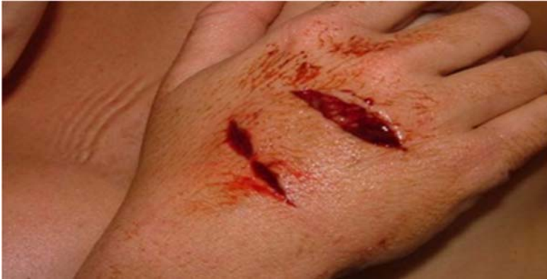
Рис. 7. Ушибленная рана.