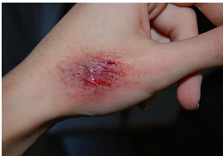
Рис. 1. Осаднение с влажным, западающим дном, с наличием инородных частиц (до 6 часов).