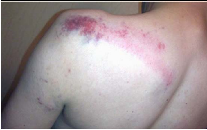
Рис. 5. Кровоподтек давностью одни сутки.