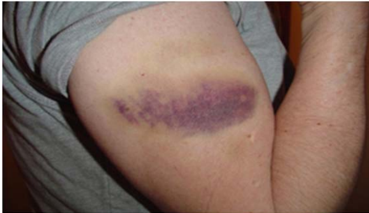
Рис.6. Кровоподтек с желтушным окрашиванием по периферии (7–10 суток).