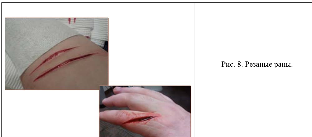
Рис. 8. Резаные раны.