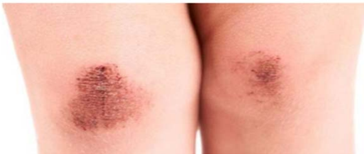
Рис.4. Ссадины с отпадающей плотной сухой корочкой коричневого цвета (7–10 сутки).