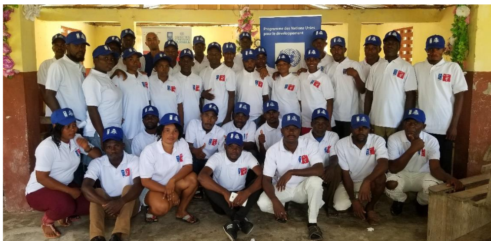
Association de gestion du village de Lahaie (KOJEVILA)