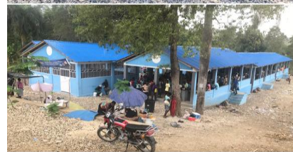
Marché Mina après la mise construction