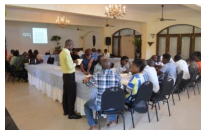
Atelier de travail avec les plateformes communautaires à Cap-Haitien