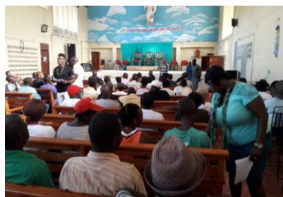
Rencontre Communautaire pour la proposition des projets