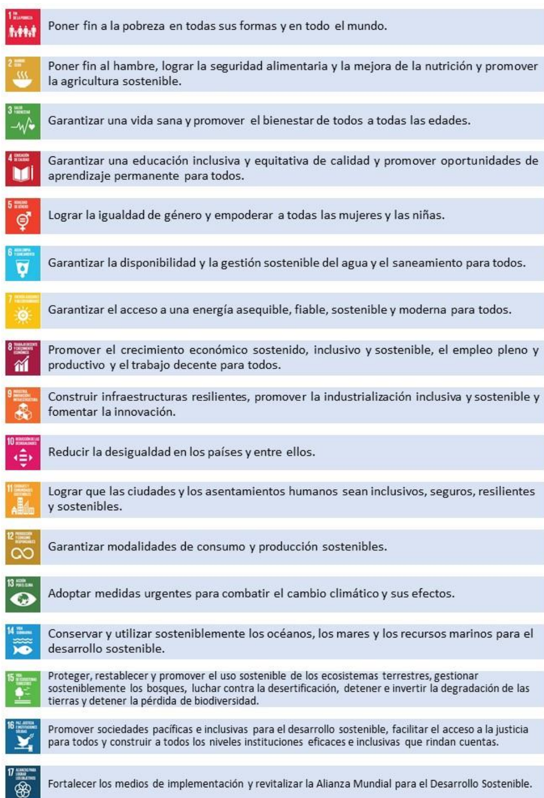
Cuadro No. 1 Objetivos de Desarrollo Sostenible de la Agenda 2030