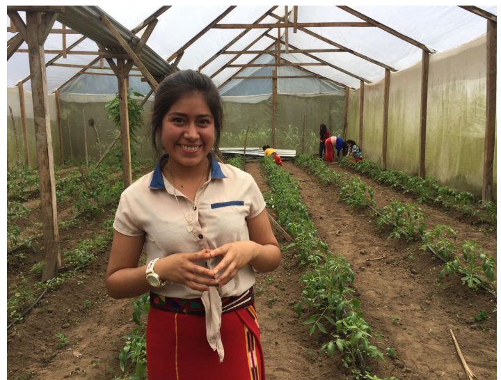
Jóvenes integrantes de la Asociación de Desarrollo Integral de Acul – ADIESA – ACUL Nebaj, produciendo hortalizas bajo condiciones controladas.