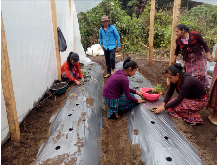
Jóvenes produciendo tomate y pimiento en la comunidad Ojo de Agua, Cotzal.

Los jóvenes participantes pertenecen a las comunidades rurales de los municipios de Santa María Nebaj, San Juan Cotzal y San Gaspar Chajul del departamento del Quiché.