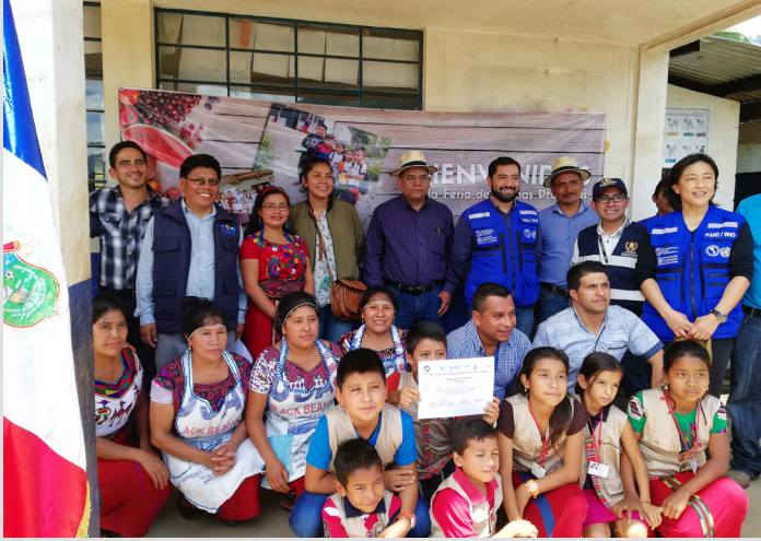
Aldea Ilom, Chajul. Fotografía, COMES, Chajul

Por medio del Programa Conjunto de Desarrollo Rural Integral Ixil -PCDRI-Ixil-, la Organización Panamericana de la Salud y Organización Mundial de la Salud -OPS/OMS- a través de la Comisión Municipal de Escuelas Saludables del municipio de Chajul, organizó la “Feria de buenas prácticas” en 40 escuelas del municipio, con la participación de 160 maestros y 200 estudiantes.