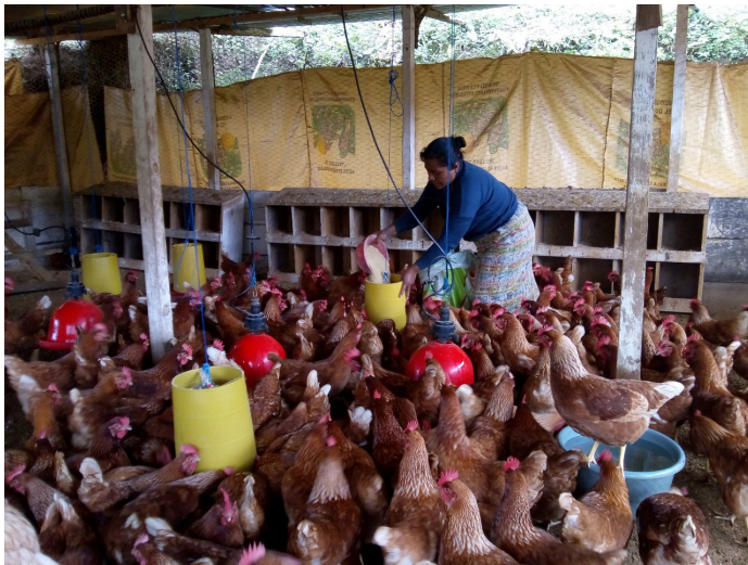
Producción de huevos para el consumo familiar y venta local, a cargo del Comité Integral de Mujeres de Santa Avelina – CIMSA – en el municipio de San Juan Cotzal.

Actualmente se preparan para continuar otros ciclos de producción para abastecer nuevos mercados, como las escuelas locales y mercados nacionales y la reinversión de los ingresos para ampliar las iniciativas y el desarrollo de habilidades empresariales.