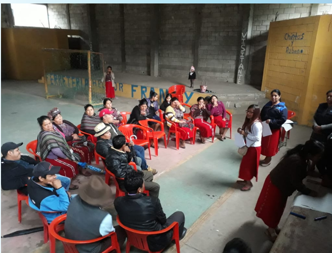
Aldea Acul, Nebaj.