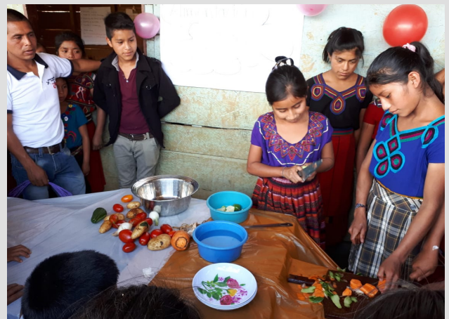
Aldea Xaxmoxan, Chajul. Fotografía, COMES, Chajul

Exposiciones de buenas prácticas, como el consumo de alimentos nutritivos, consumo de agua segura, lavado de manos, lavado de dientes, coordinación y gestión comunitaria e institucional, y fortalecimiento de los gobiernos escolares.