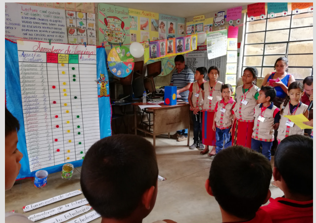
Aldea Ilom, Chajul. Fotografía, COMES, Chajul

Exposiciones de buenas prácticas, como el consumo de alimentos nutritivos, consumo de agua segura, lavado de manos, lavado de dientes, coordinación y gestión comunitaria e institucional, y fortalecimiento de los gobiernos escolares.