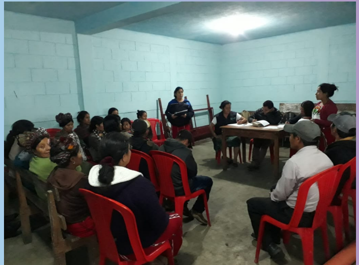
Aldea Acul, Nebaj.

Con este estudio se pretende tener una mejor visión de las necesidades de las mujeres y de esta forma poder gestionar y dirigir de forma directa los proyectos para contribuir en la solución a corto, mediano y largo plazo de la problemática identificada.