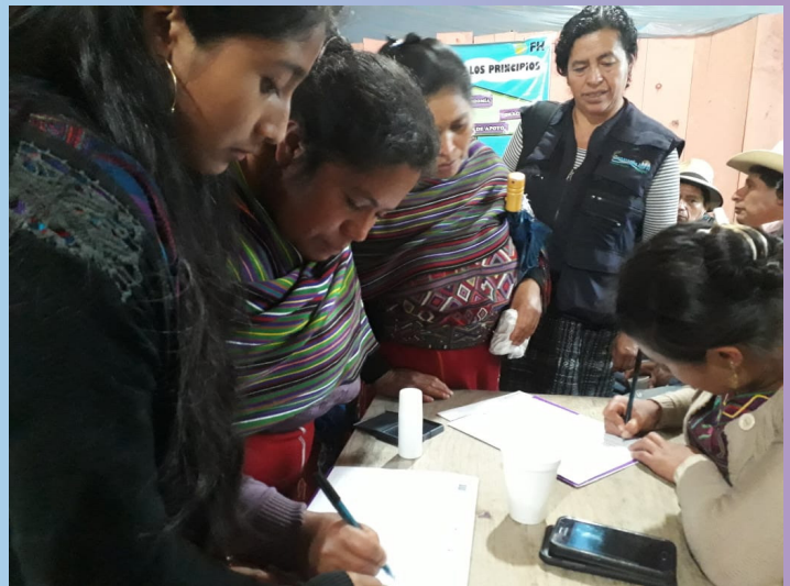
Aldea Acul, Nebaj.