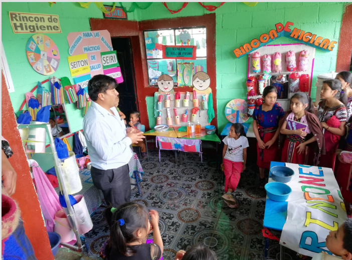
Aldea Visichuj, Chajul.

Estas acciones se llevan a cabo durante el ciclo ordinario de clases y son ejecutadas por la comunidad educativa. Este año se han desarrollado cuatro ferias de buenas prácticas lo que ha incentivado a otros centros educativos a replicar la experiencia.