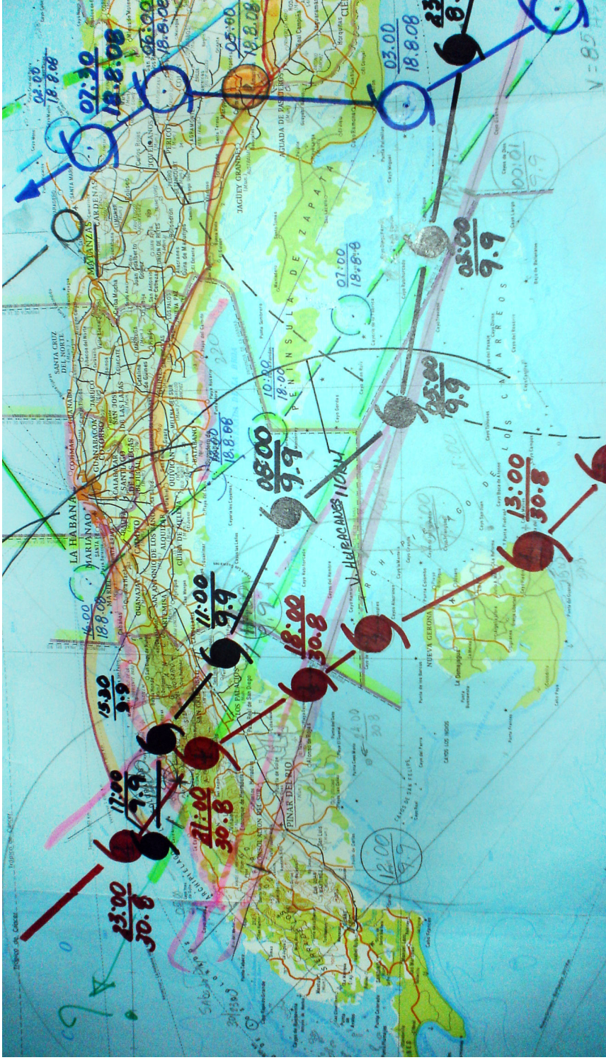
FIGURA 1. EJEMPLO DE LOS CÁLCULOS REALIZADOS DURANTE EL PASO DEL HURACÁN IKE POR NUESTRO PAÍS.